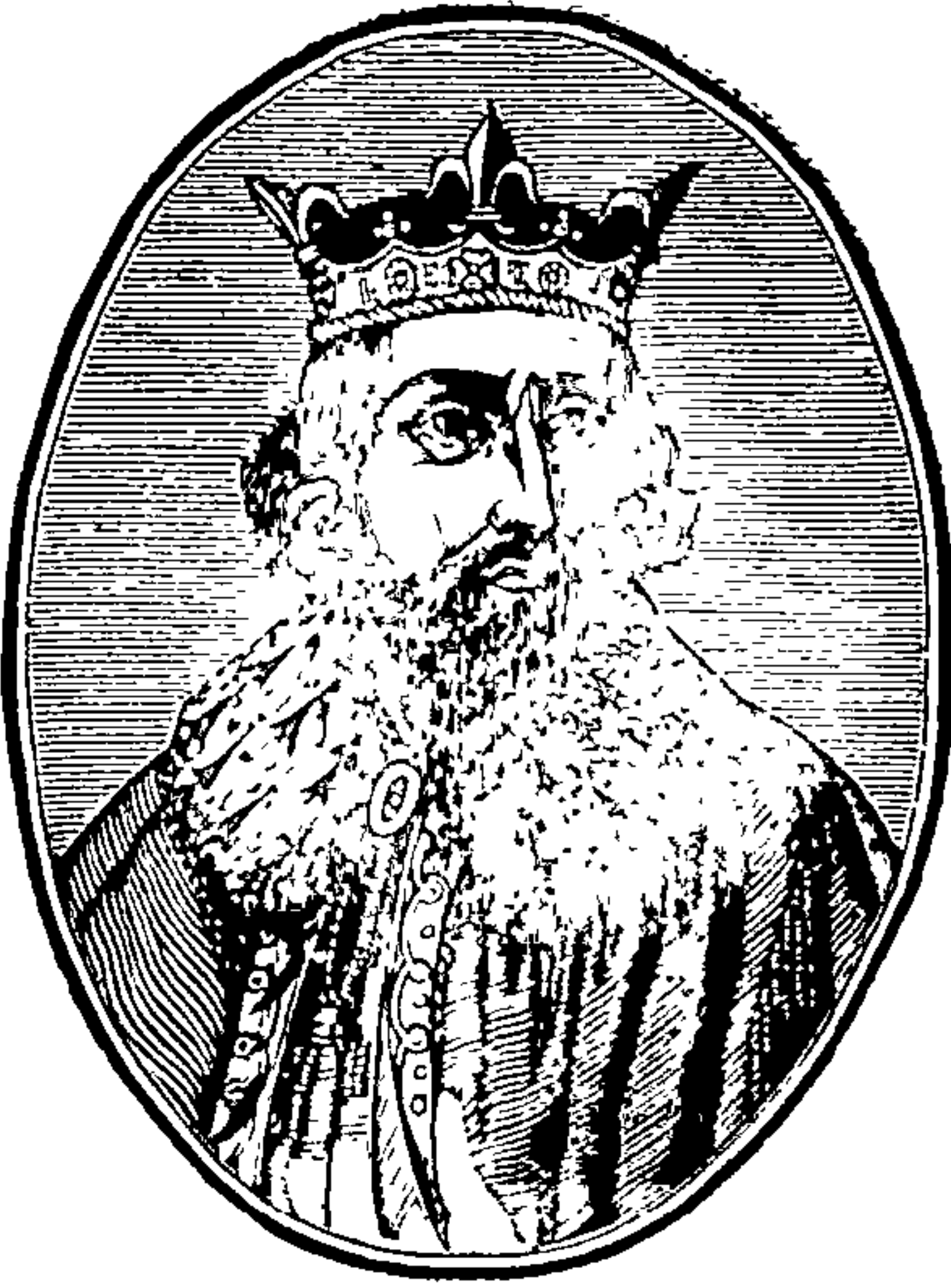
आलफ्रेद धि ग्रेत.