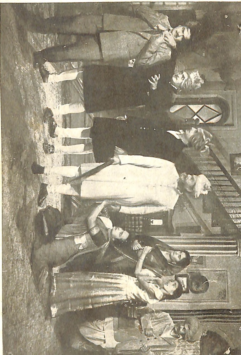
जातकी:—तो राक्षस सांगतो तें साफ खोटं आहे.