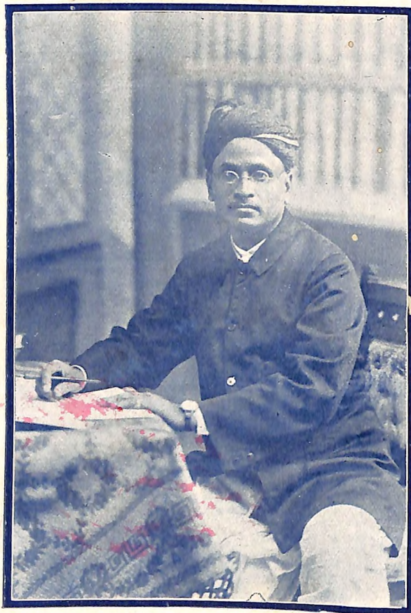
कै. हरीभाऊ आपटे