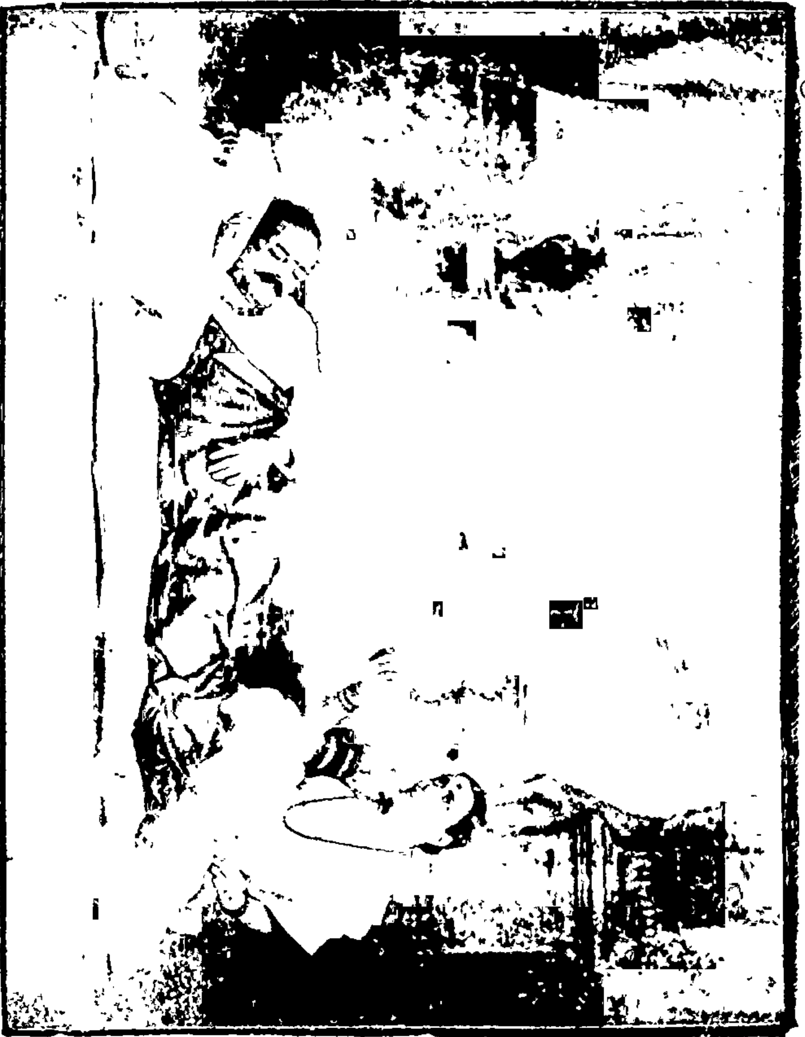
सरखुवाई:— या पायांना सोडून कशाला पंढरपूर न् कशाला काशी ! [ पृष्ठ २८.