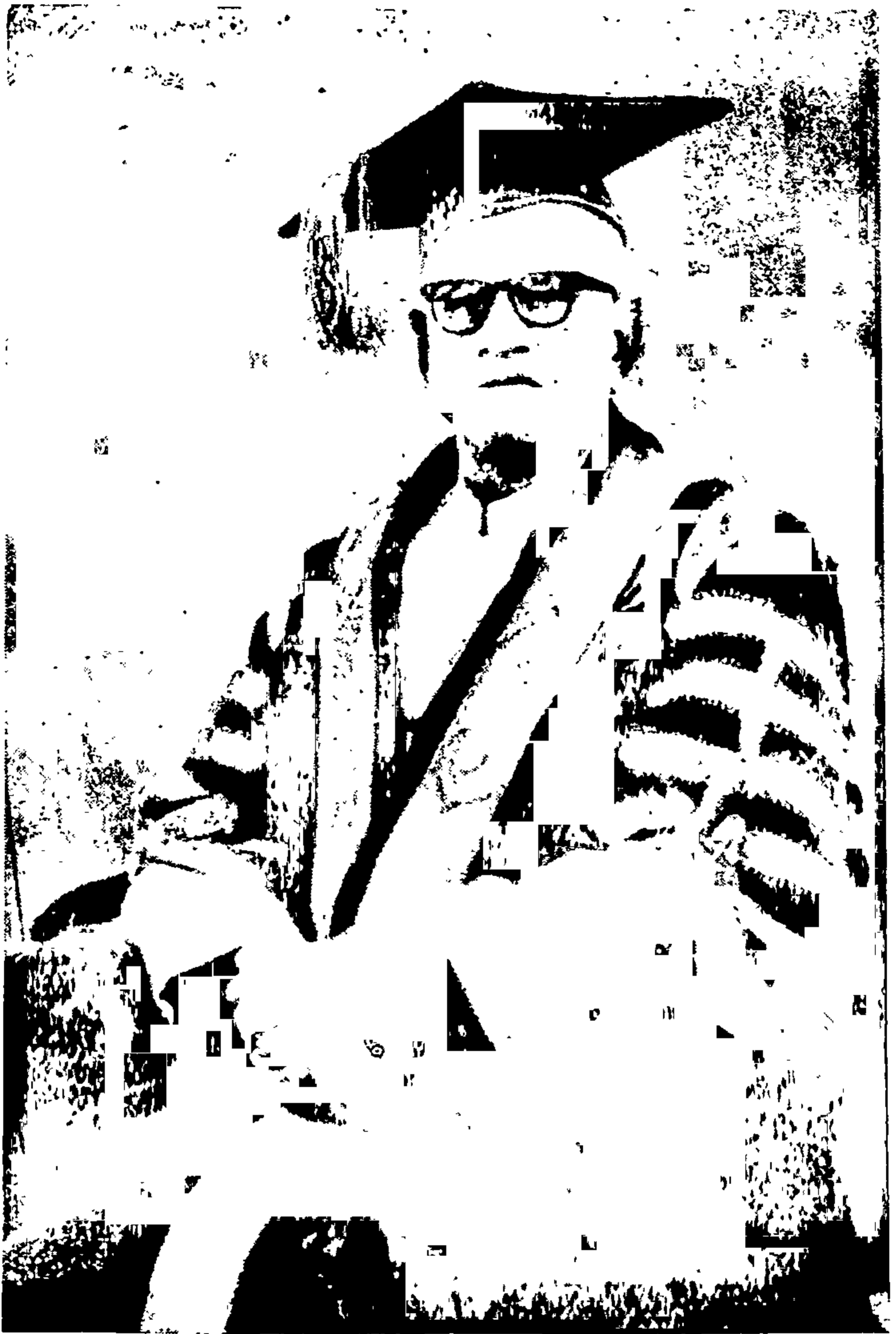
पुणे विद्यापीठाचे कुलगुरू डॉ. न वि गाडगीळ