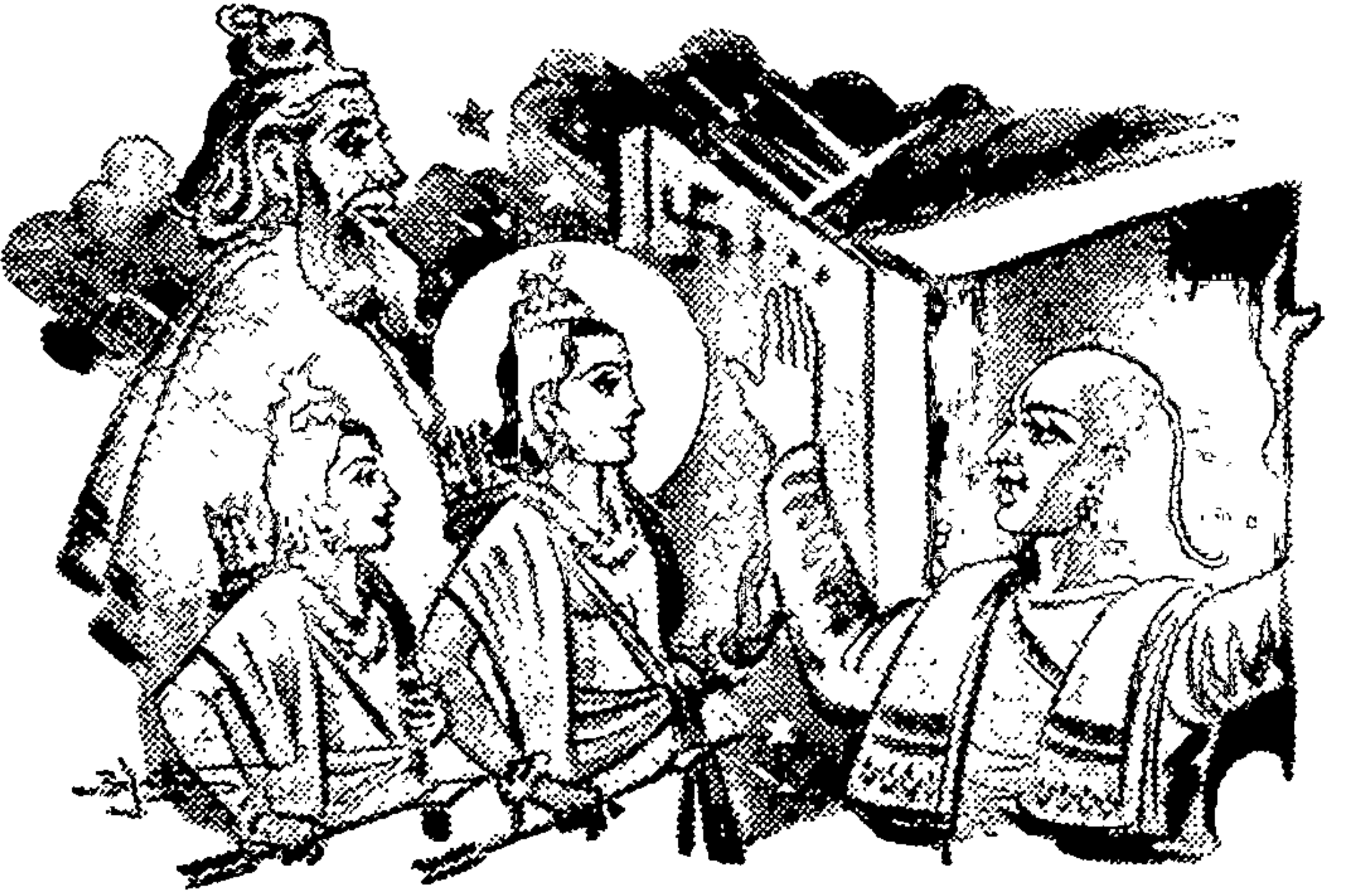
राम-लक्ष्मण त्यागराजाच्या दारांत

अन्कुठला सत्कार ! प्रभूच्या सांवळ्या रूपांत तळीन झाल्यावर कोण कोणाला 'या' म्हणणार आणि कोण कोणाला आसन देणार ! त्याग-