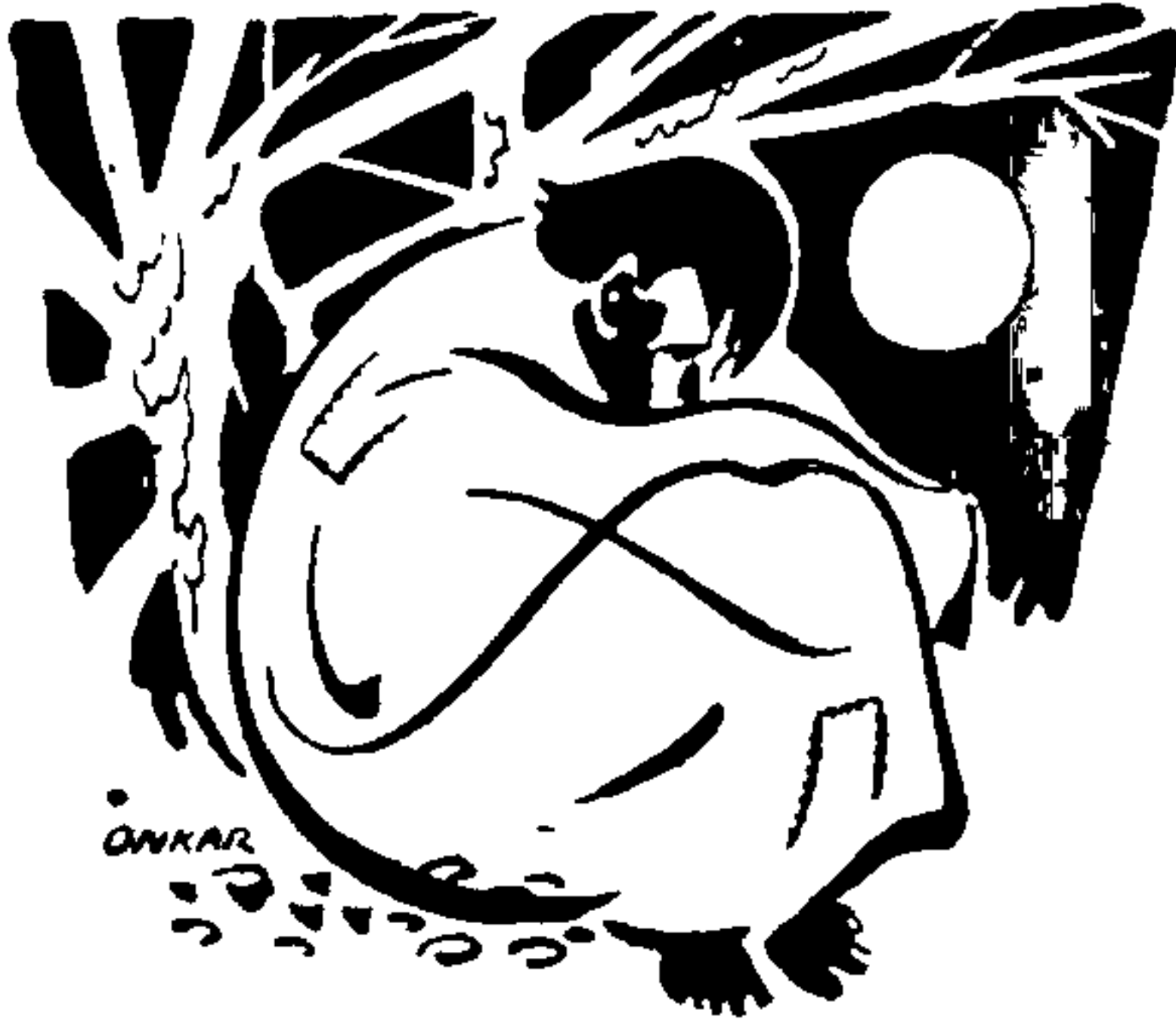
मातृगुप्त झाडाखालीं विसावतो

होती; पण तेंच अंतर त्याला योजनाप्रमाणें वाटत होतें. त्याचें सर्वांग घामानें निथळलें होतें. गोरें तोंड जास्वंदासारखें लालगुंज झालें होतें. त्याच्या काखेंत तो लिहित असलेल्या ग्रंथाची पोथी होती; तेवढेंच काय तें त्याचें भांडवल !