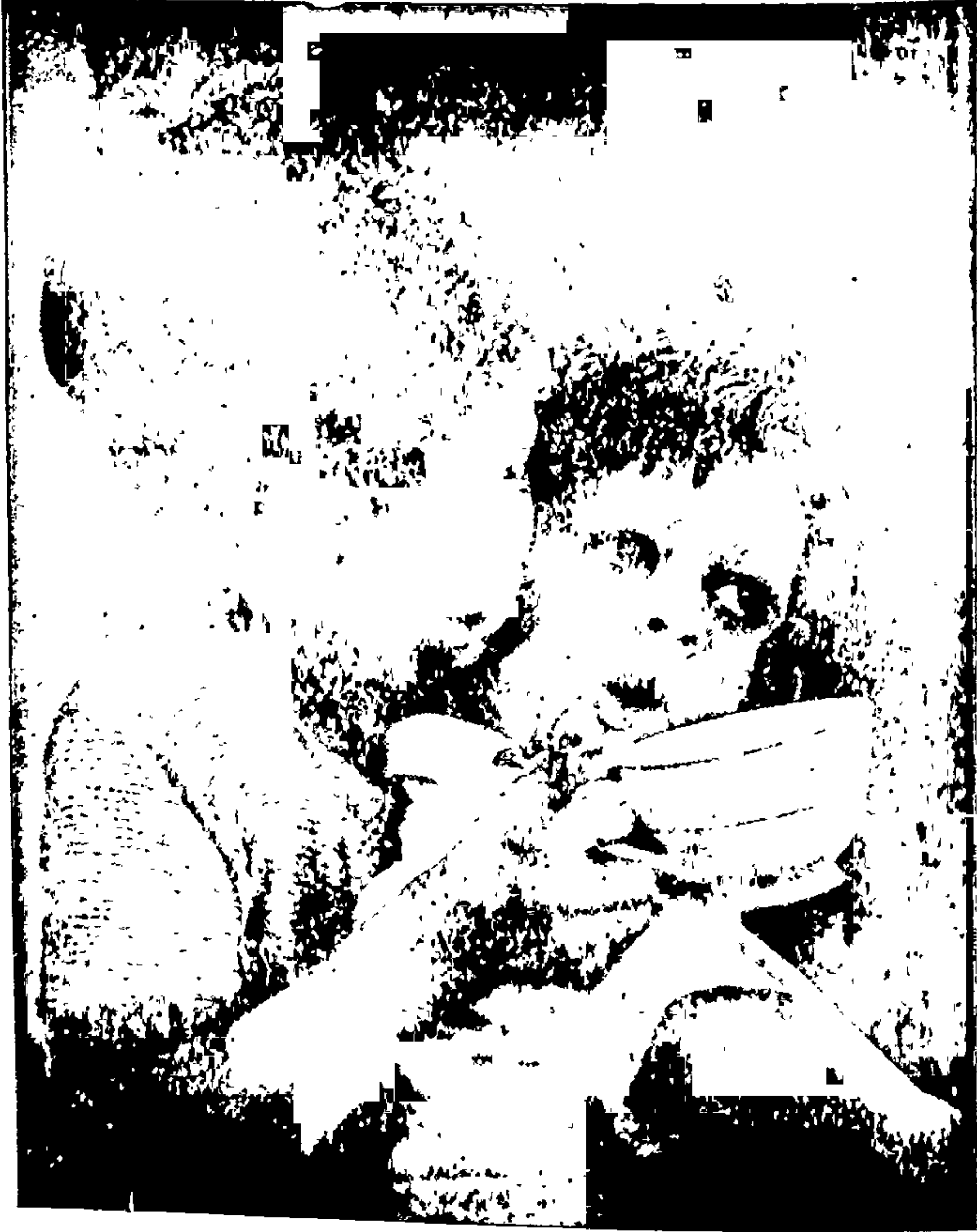
मोहन नेहमीं आपुलकीनें सर्वांना मदत करीत असे.