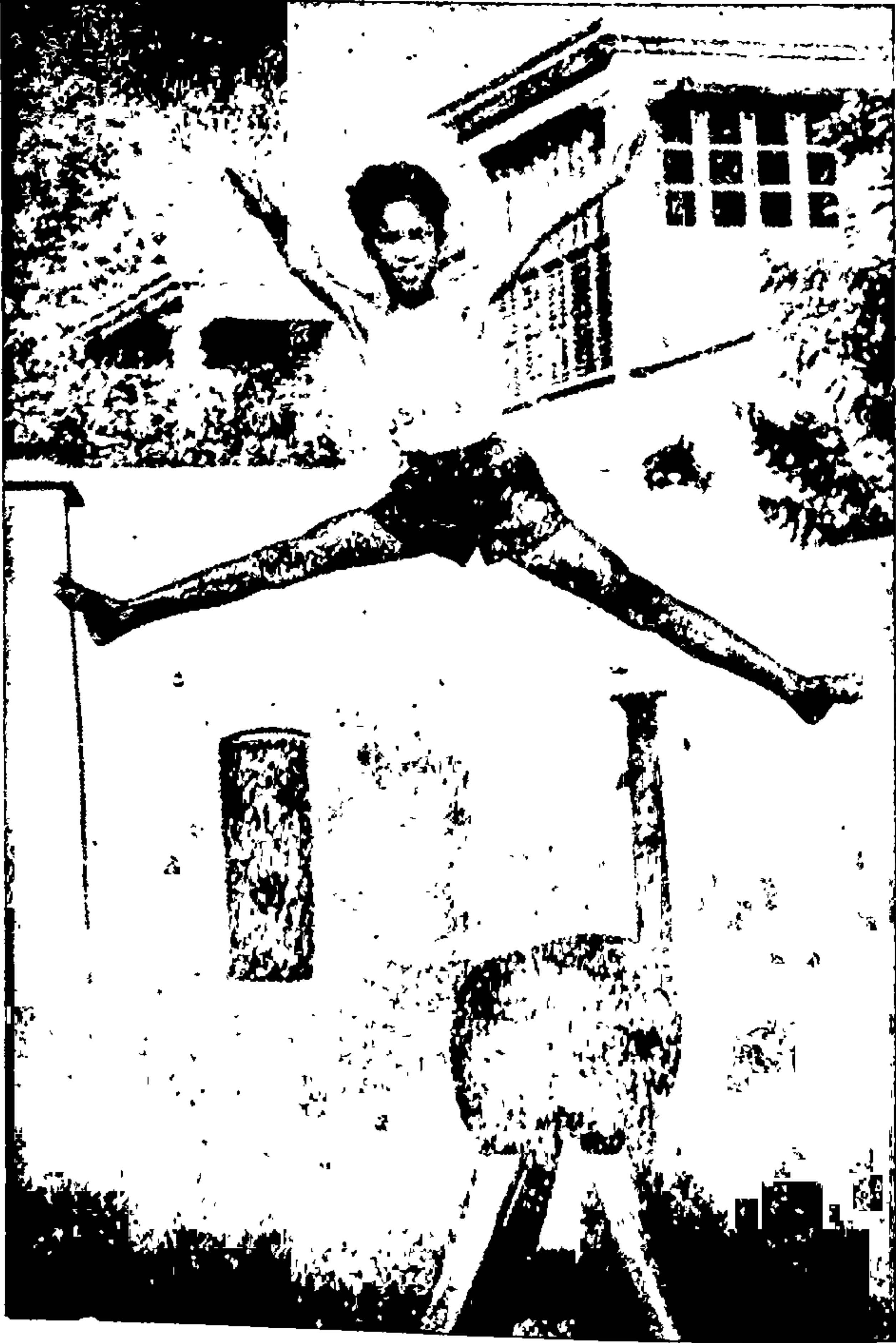
चांगले आरोग्य काळजीपूर्वक कमवावे लागते.