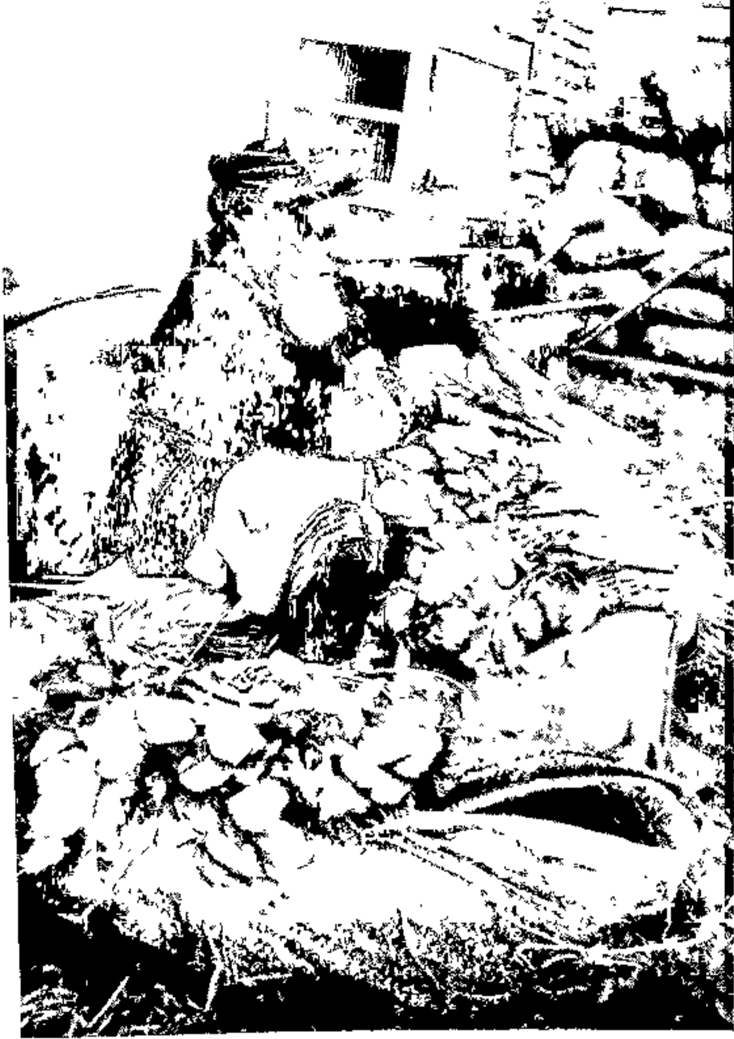
ओमानच्या खेड्यातील बाजारात भाजी विकणारा दुकानदार ( पृष्ठ ४० )