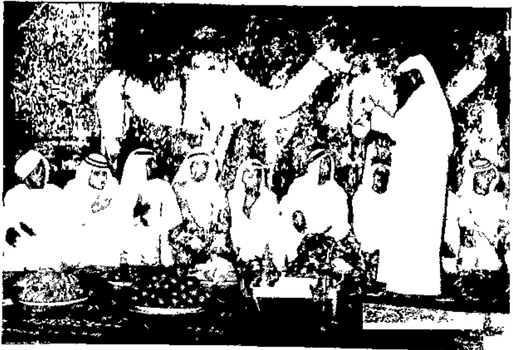
सामुदायिक मेजवानी, अबू धावी ( पृष्ठ ८१ )