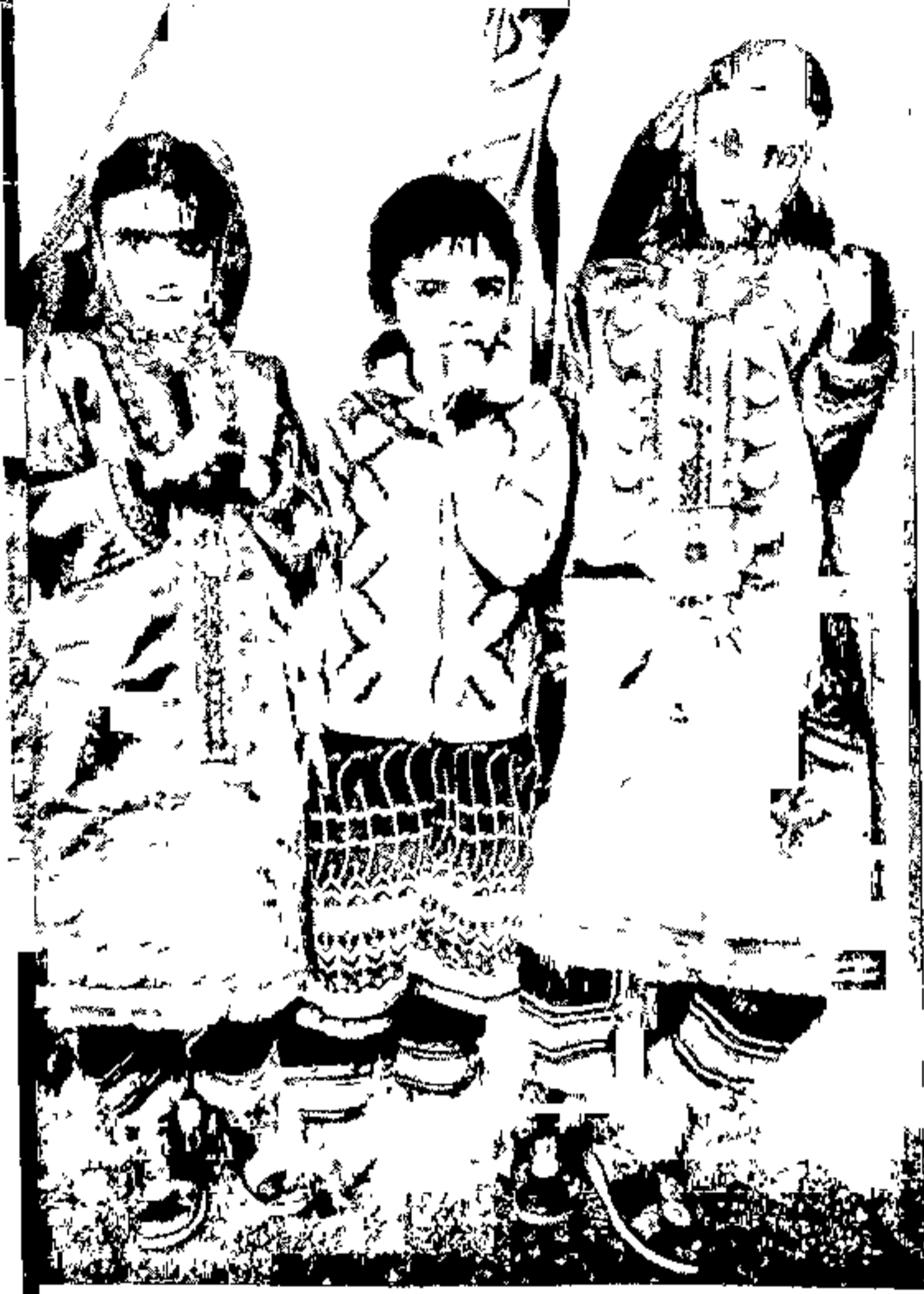
ओमानी मुले त्यांच्या राष्ट्रीय पोशाखात ( पृष्ठ २८ )