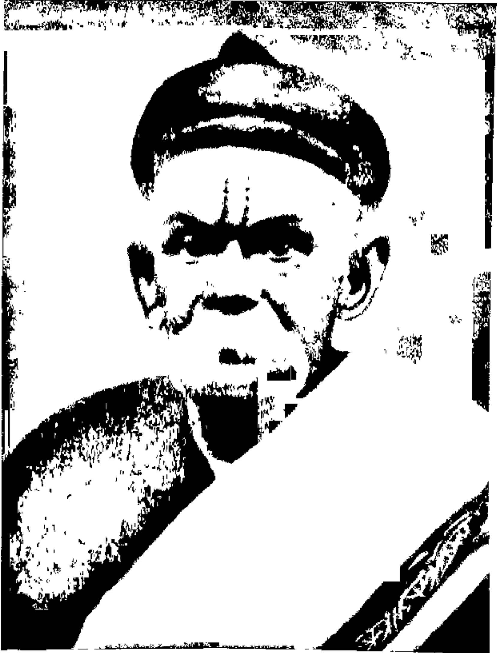
बाळकृष्ण बापू आचार्य