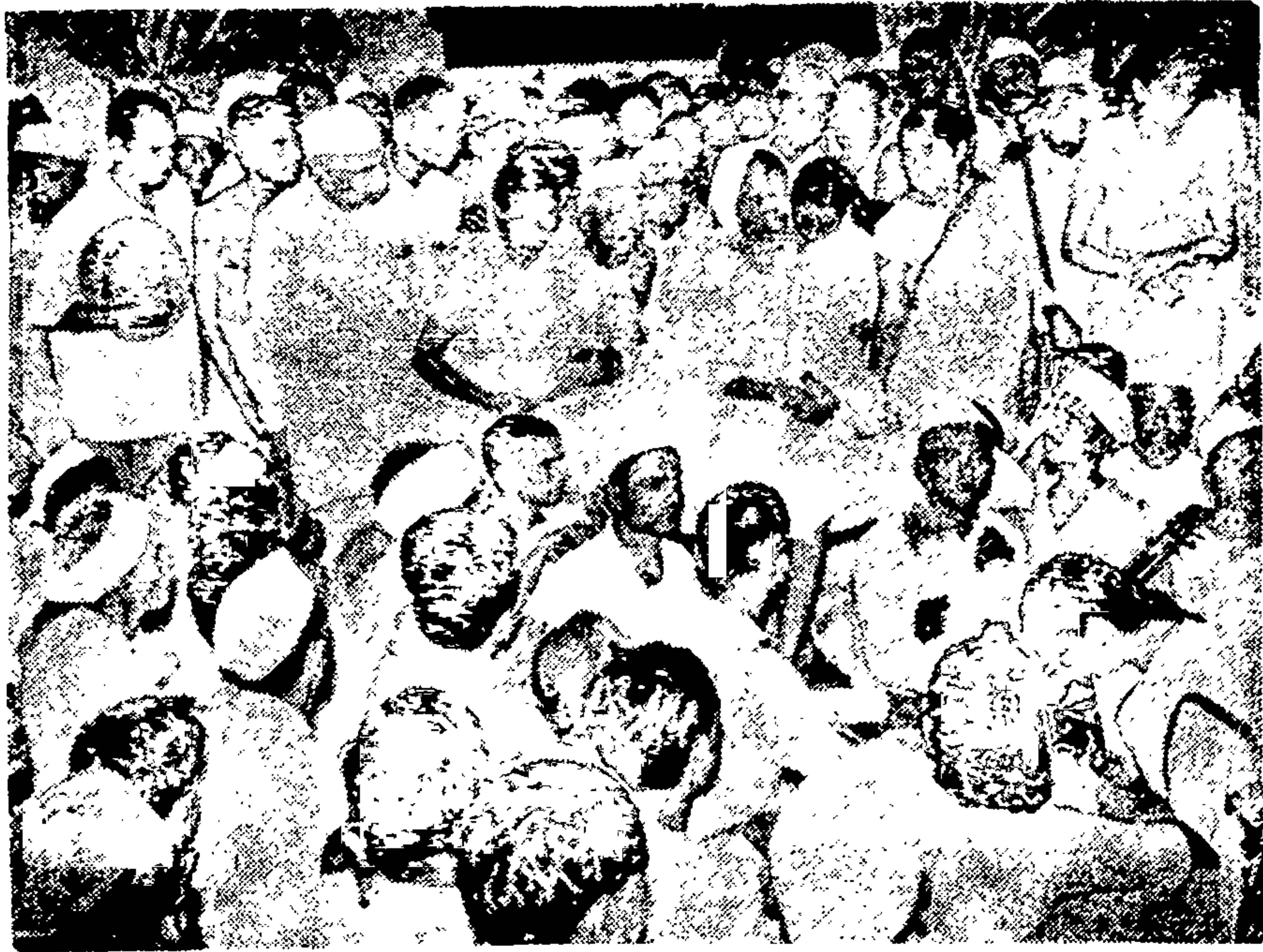
पुंडलीकाच्या भेटानंतर पुंडलीकाच्या मंदिरांत भाषण देतांना