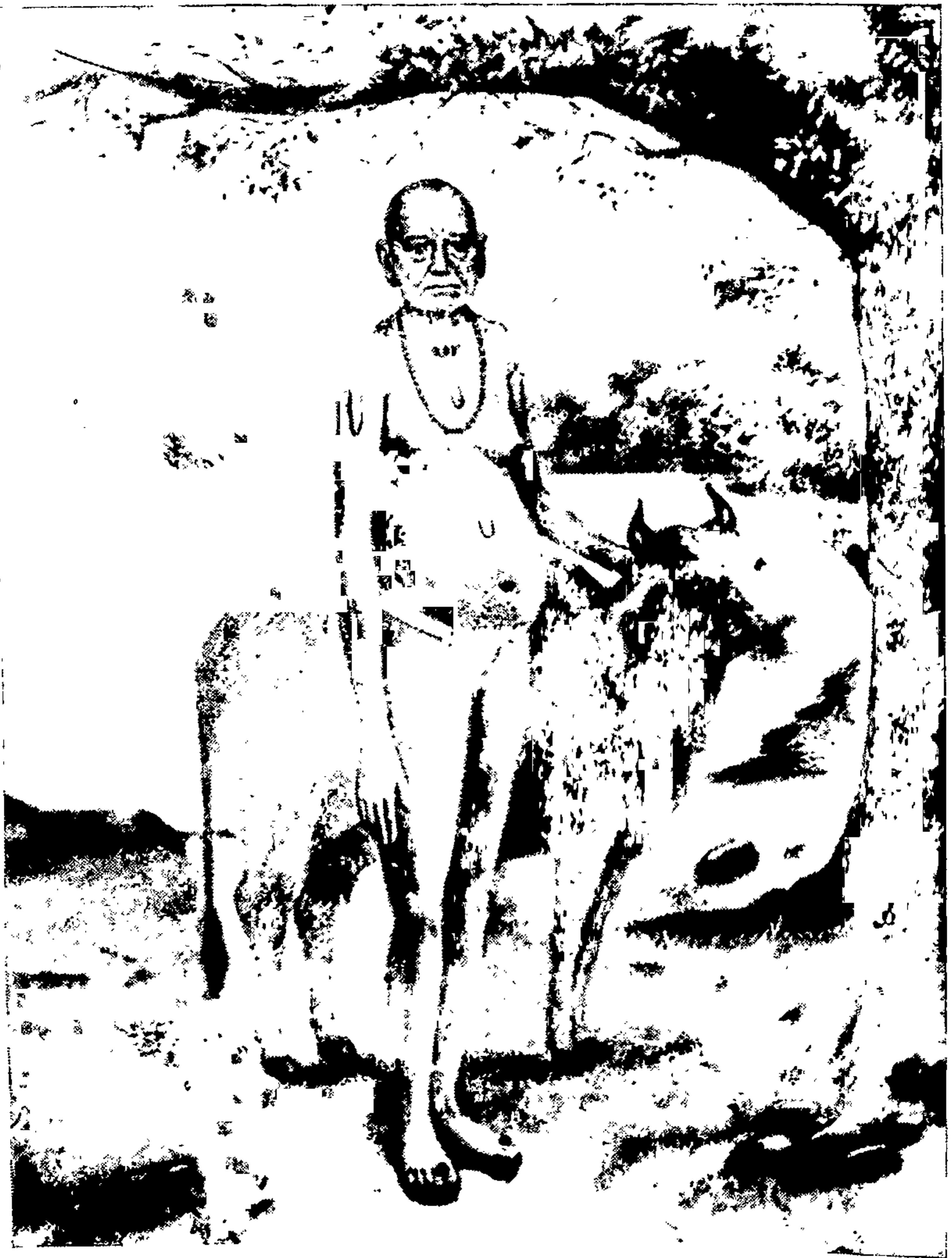
राजाधिराज योगिराज श्रीस्वामीसमर्थ भकलकोट महाराज