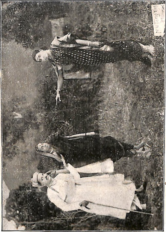
वारणसोः-चांगुणा, अग, सोड-सोड-ल्यांना.