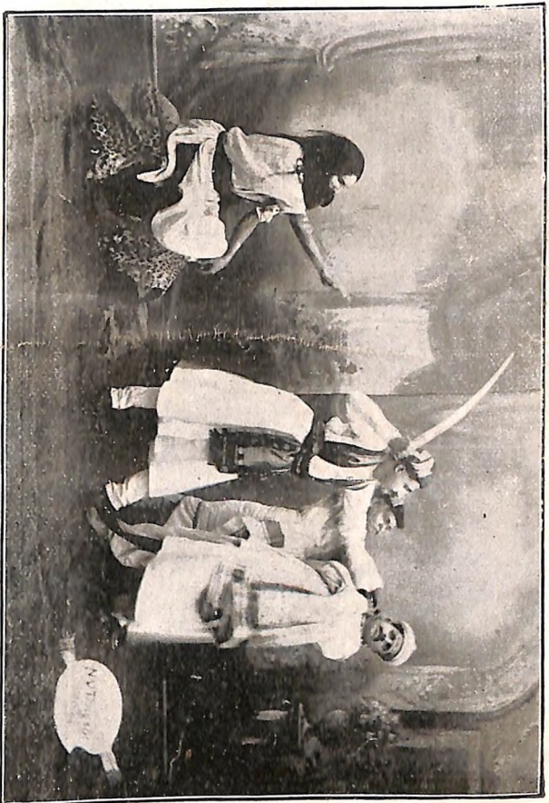
ठाकरदासबुवाः—बापू, सोला थाला,