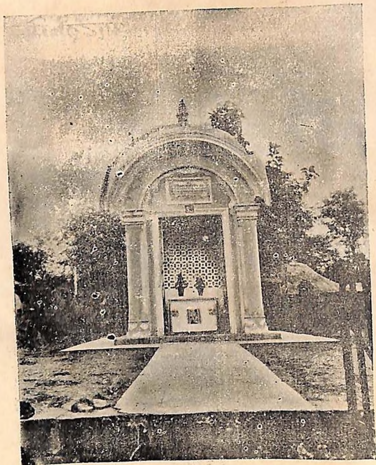
खालापूर येथील मंदिर