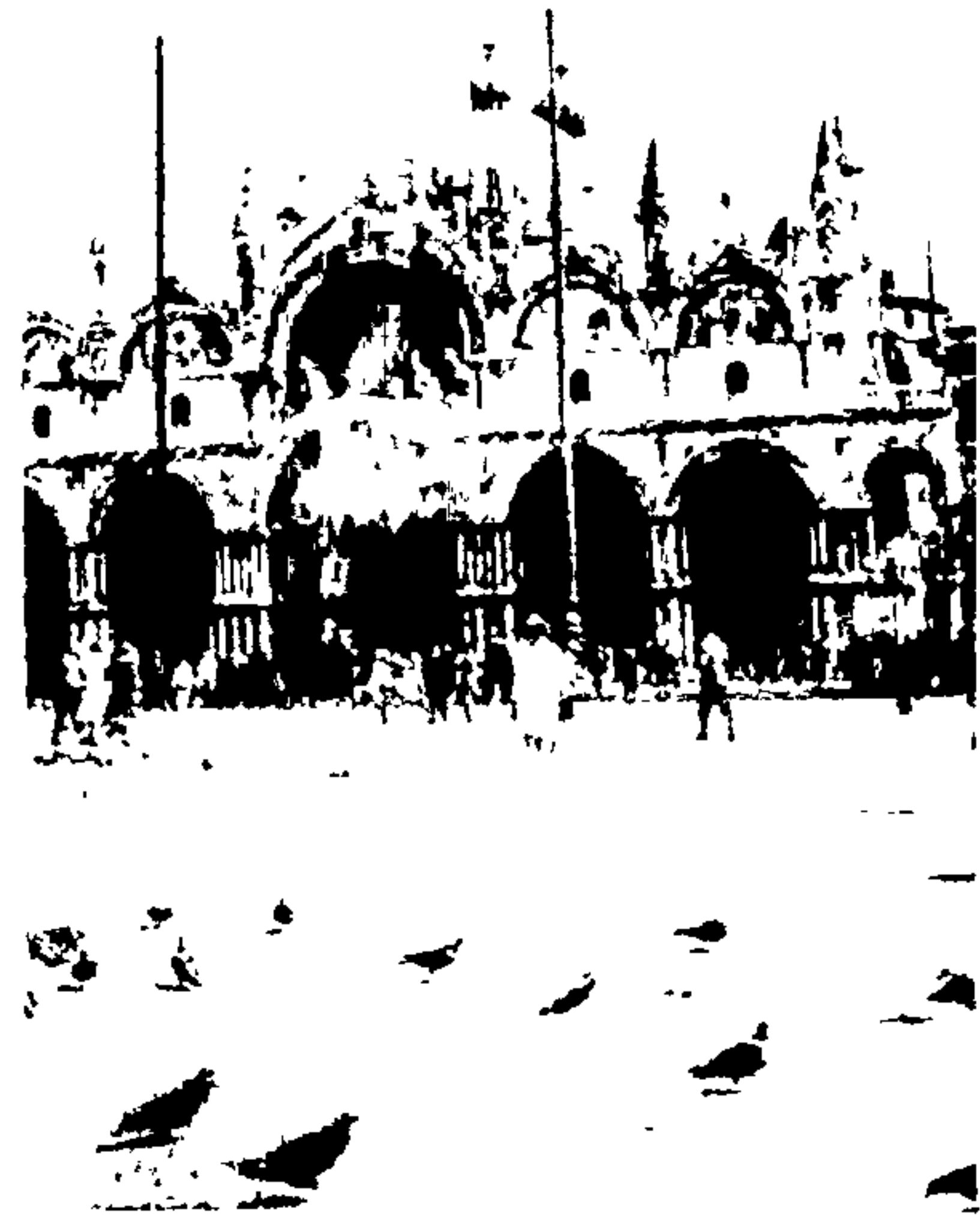
सेंट् मार्क्चे देऊळ-व्हेनिस् [ पृ. ७ ]