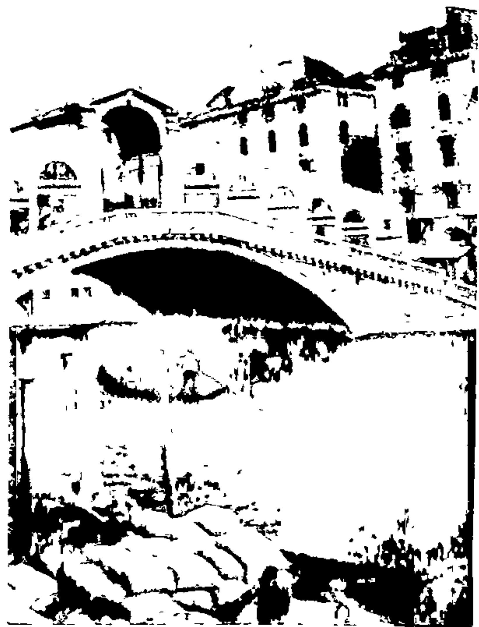
रिआल्टो पूल-व्हेनिस् [ पृ. ७ ]