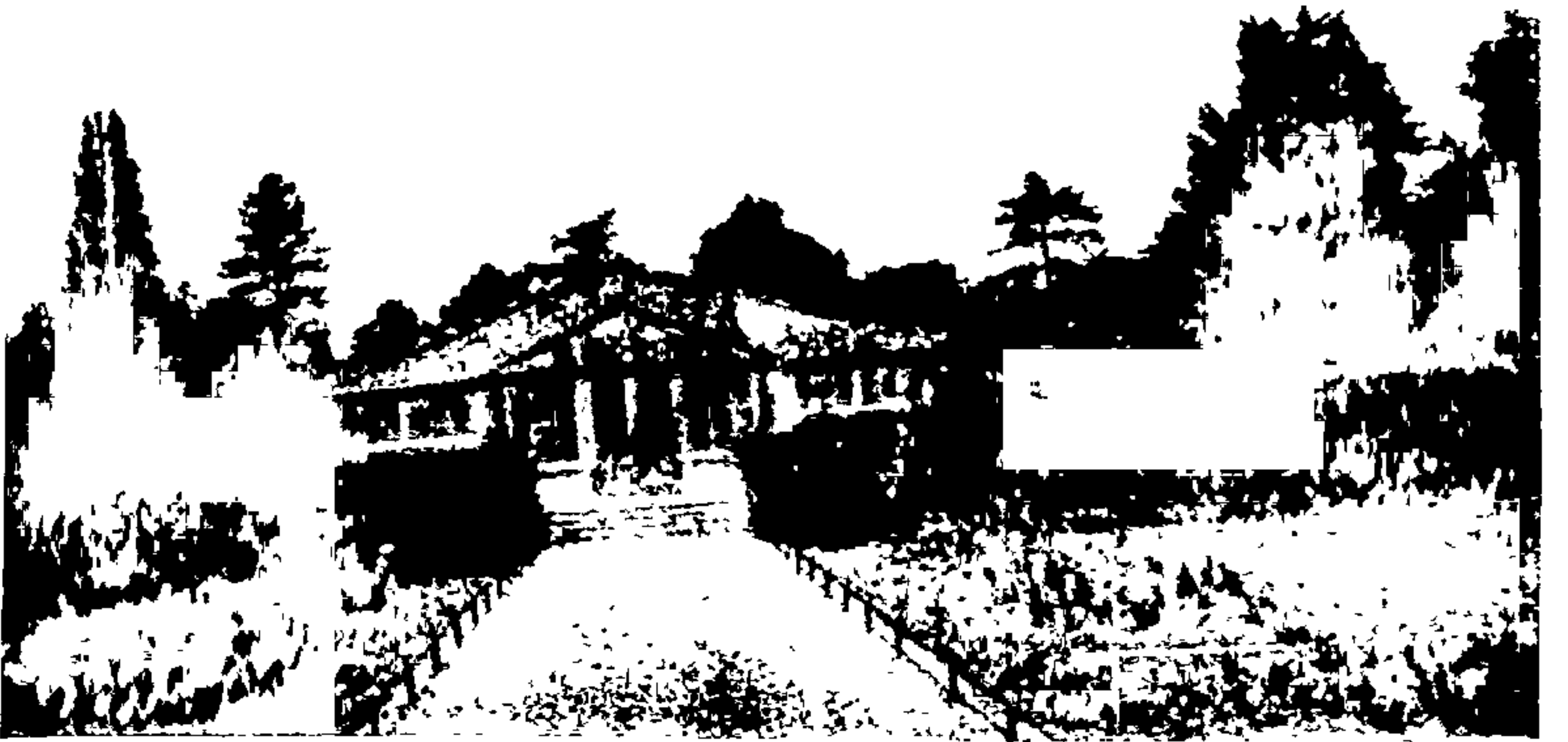
दुधी भोपळा, कारलें वगैरे आमच्या देशच्या भाज्या असलेली क्यू बगिच्यांतली कांचेची इमारत