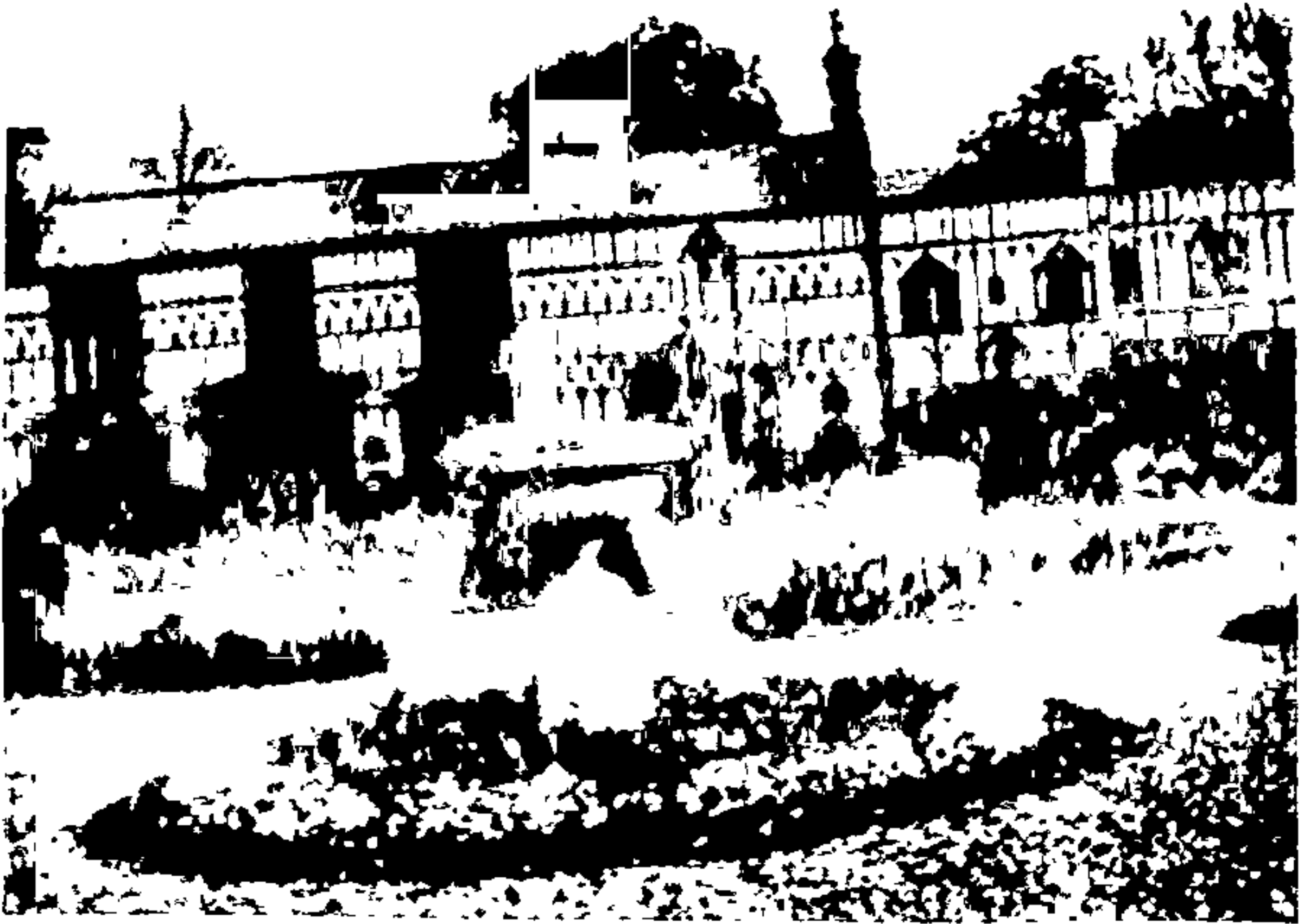
लड्गाँखलेन् येथल्या दोन प्रसिद्ध स्त्रियांचें घर [ पृ. ६१ ]