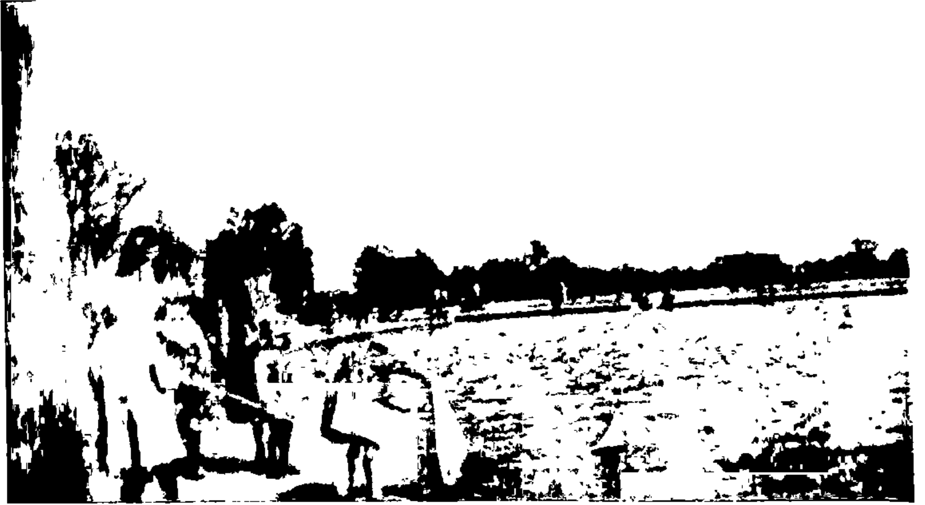
हॅम्स्टेड् हीथवरचे कृत्रिम तळें