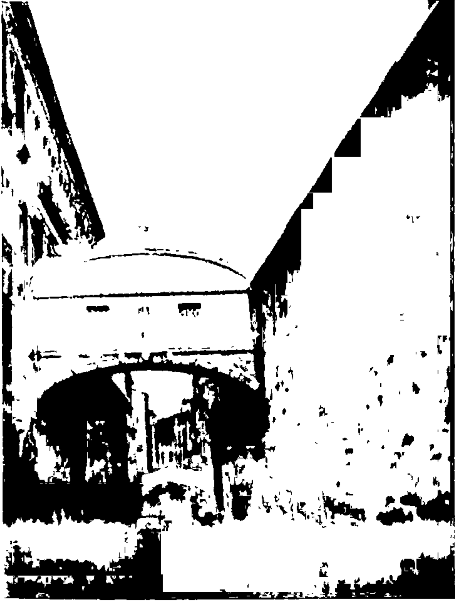
“ हुंदक्यांचा पूल ”-व्हेनिस्