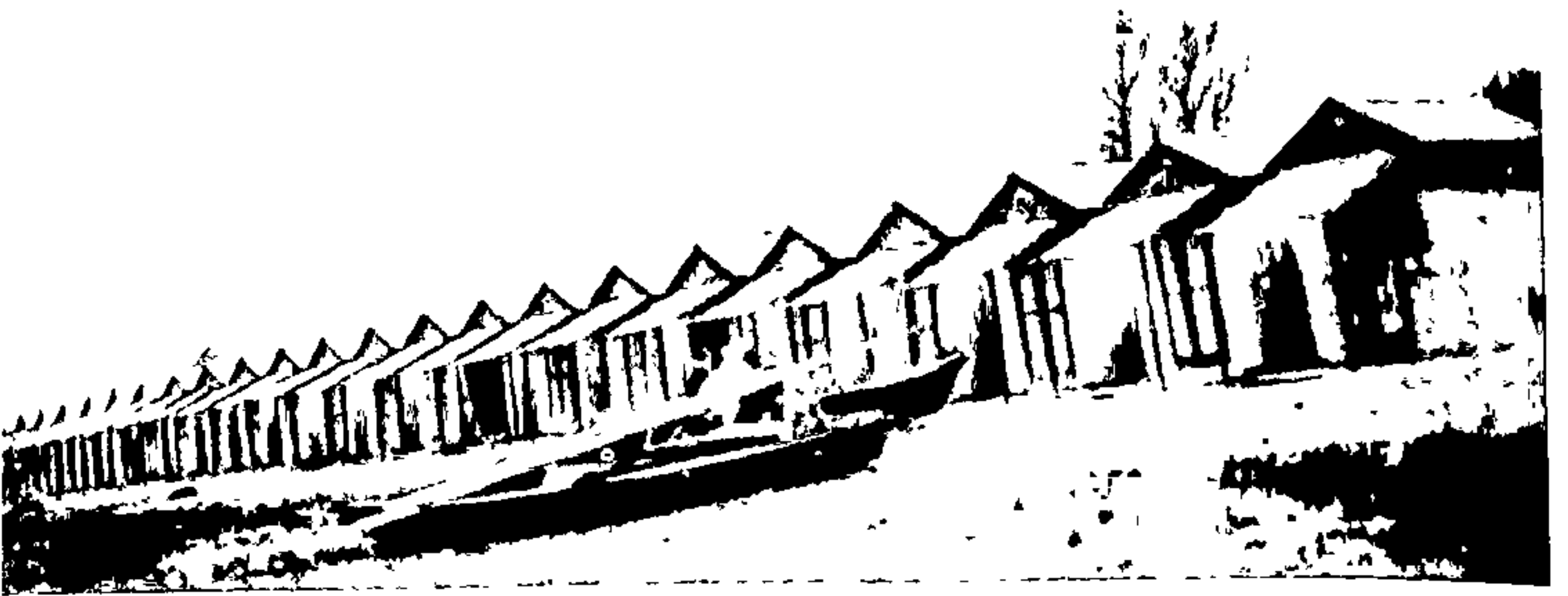
‘लीडो’च्या किनाऱ्यावरील कपडे बदलण्याच्या खोल्या