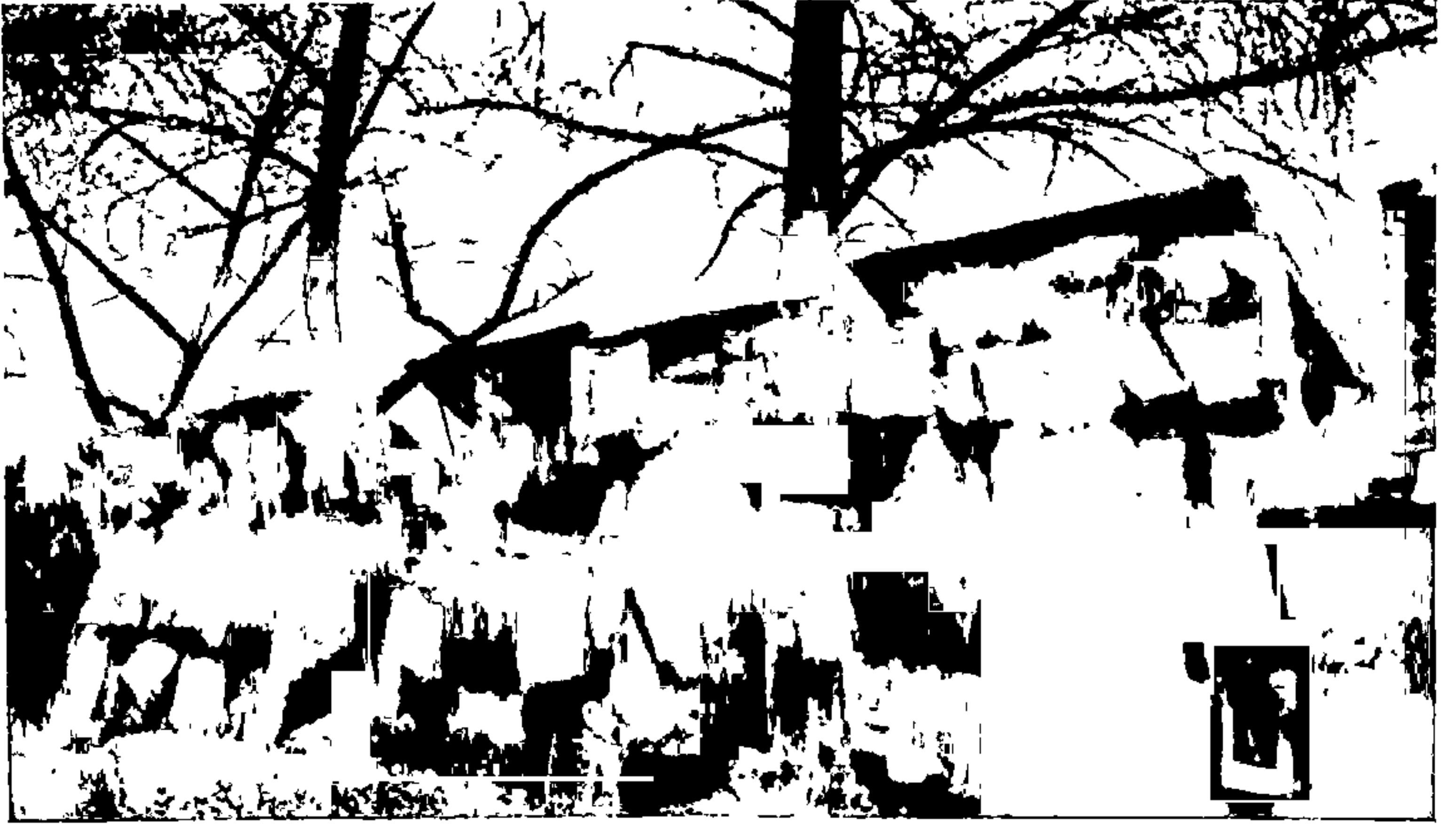
सेन् नदीच्या बाजूच्या भिंतीवरील जुन्या पुस्तकांची दुकाने—पॅरिस् [ पृ. १८३ ]