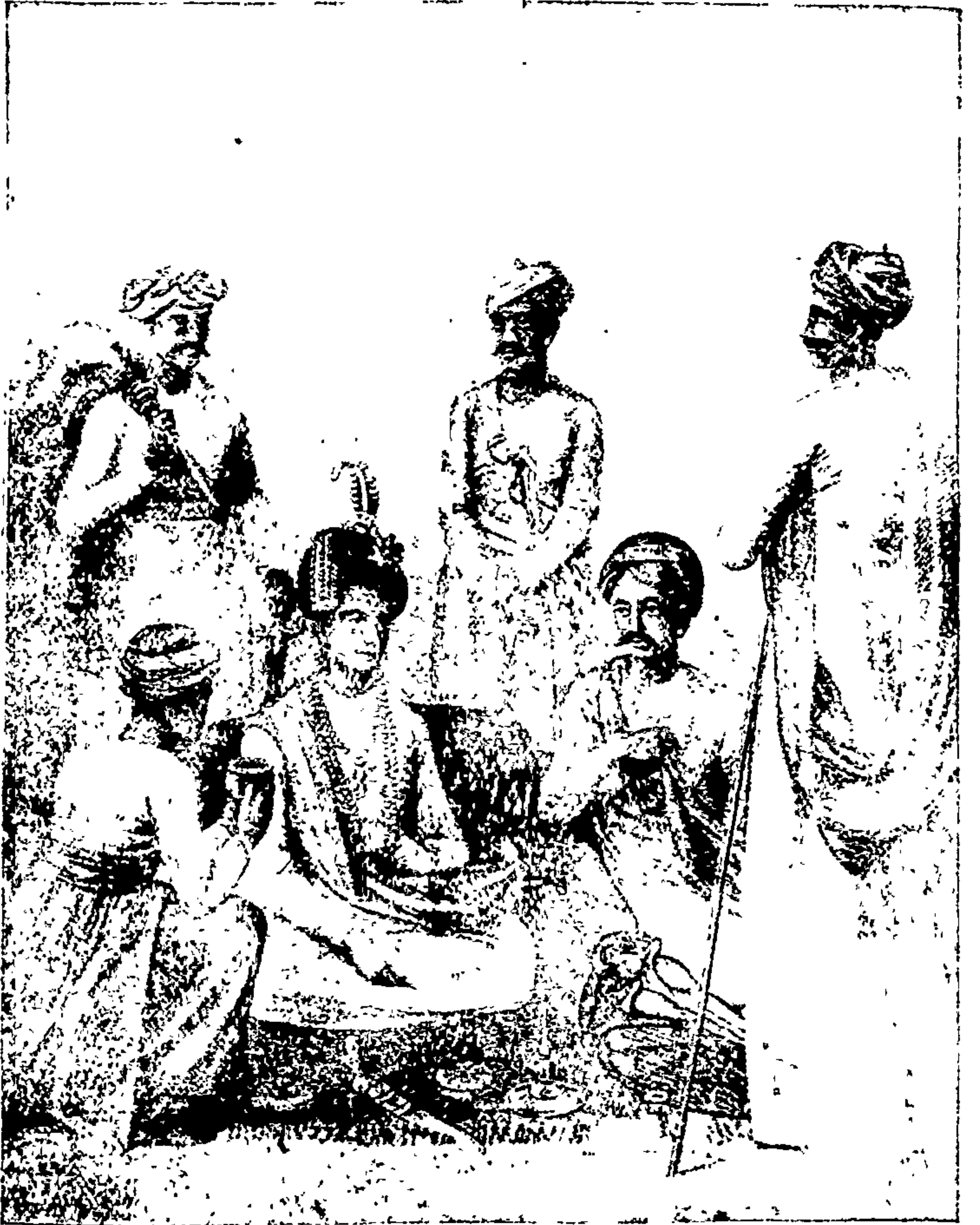
सवाई माधवराव व नाना फडणीस