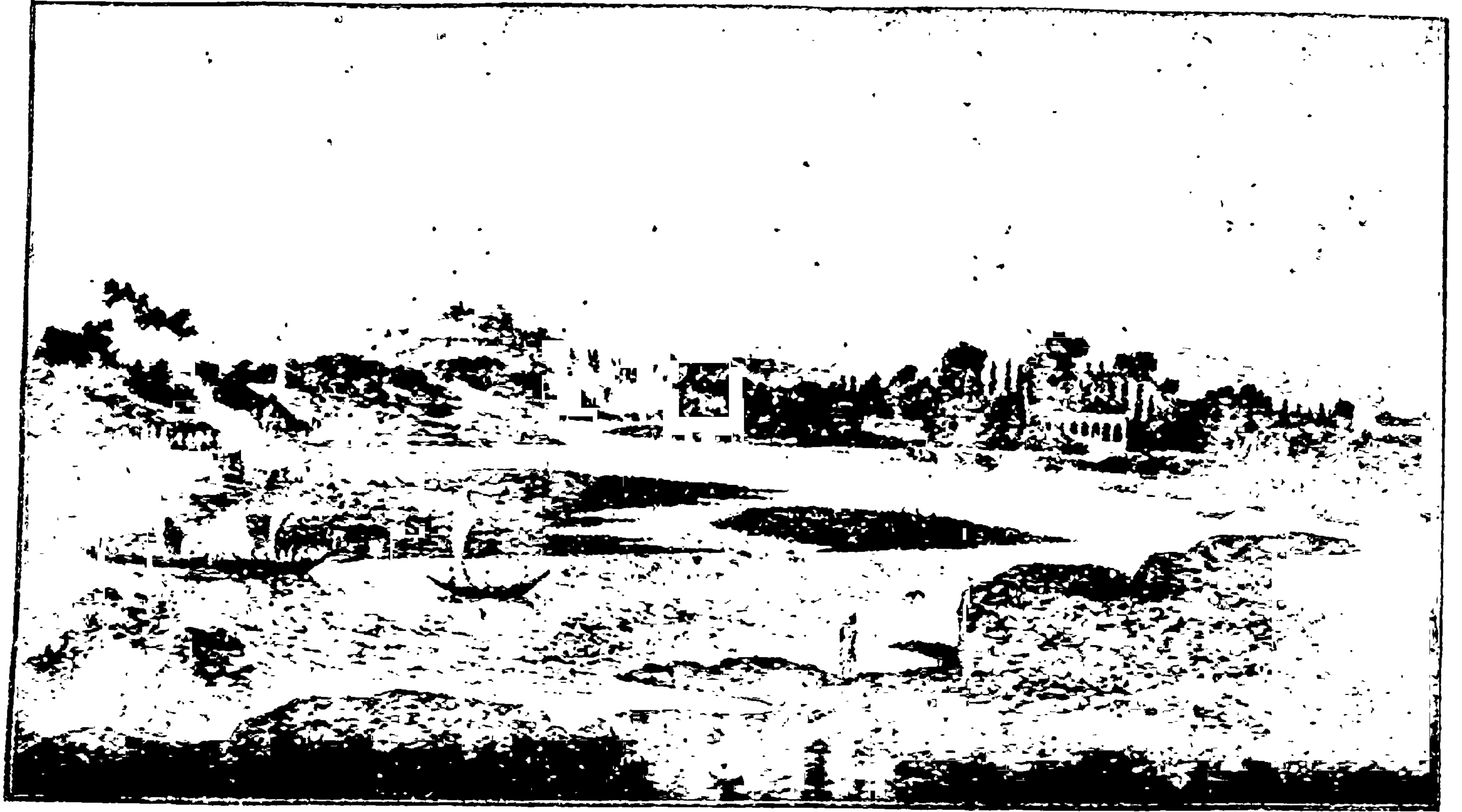
शंभर वर्षापूर्वीचे पुणे