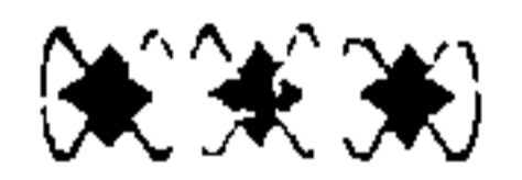
नारभट सावकार व न्यायाधिश (अंक १ प्र. २)