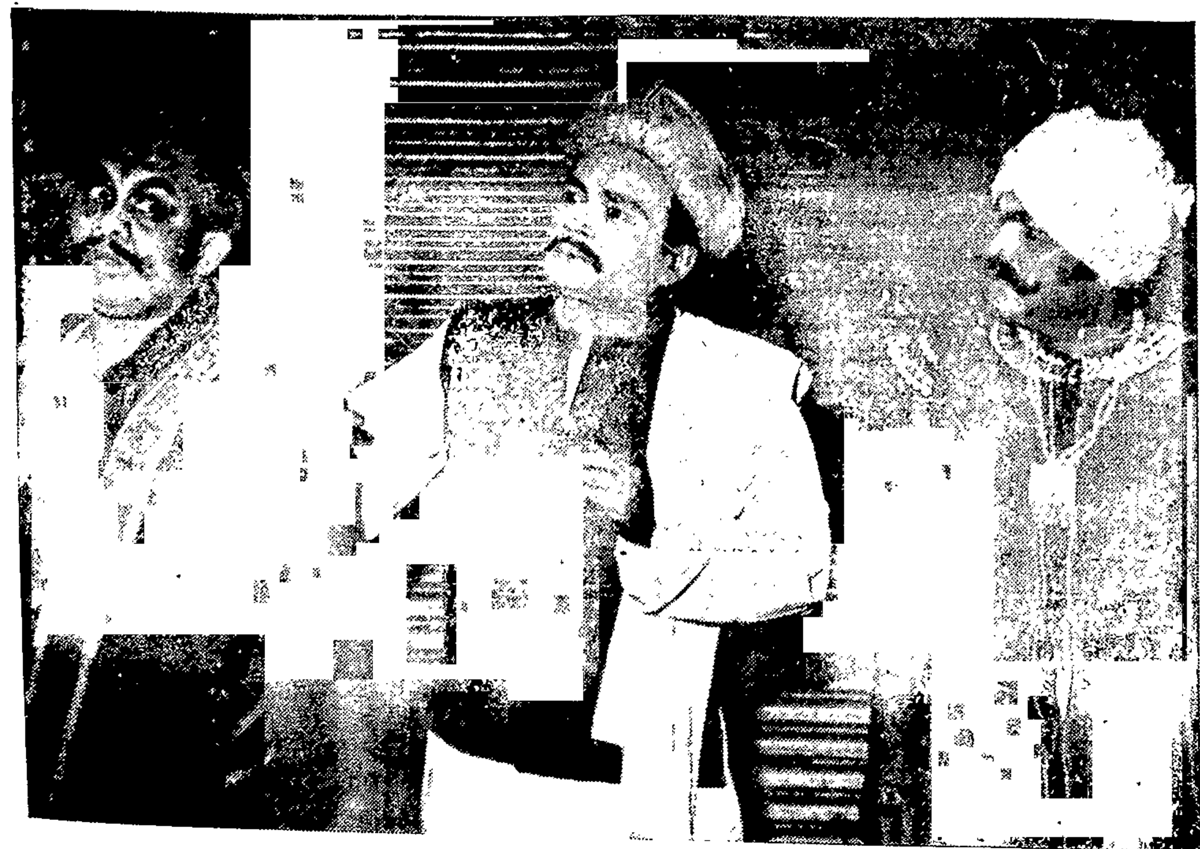
जोतीराव फुले यांना मारण्यास आलेल्या मारेकऱ्यांचे हृदयपरिवर्तन (अंक १ प्र. ३)