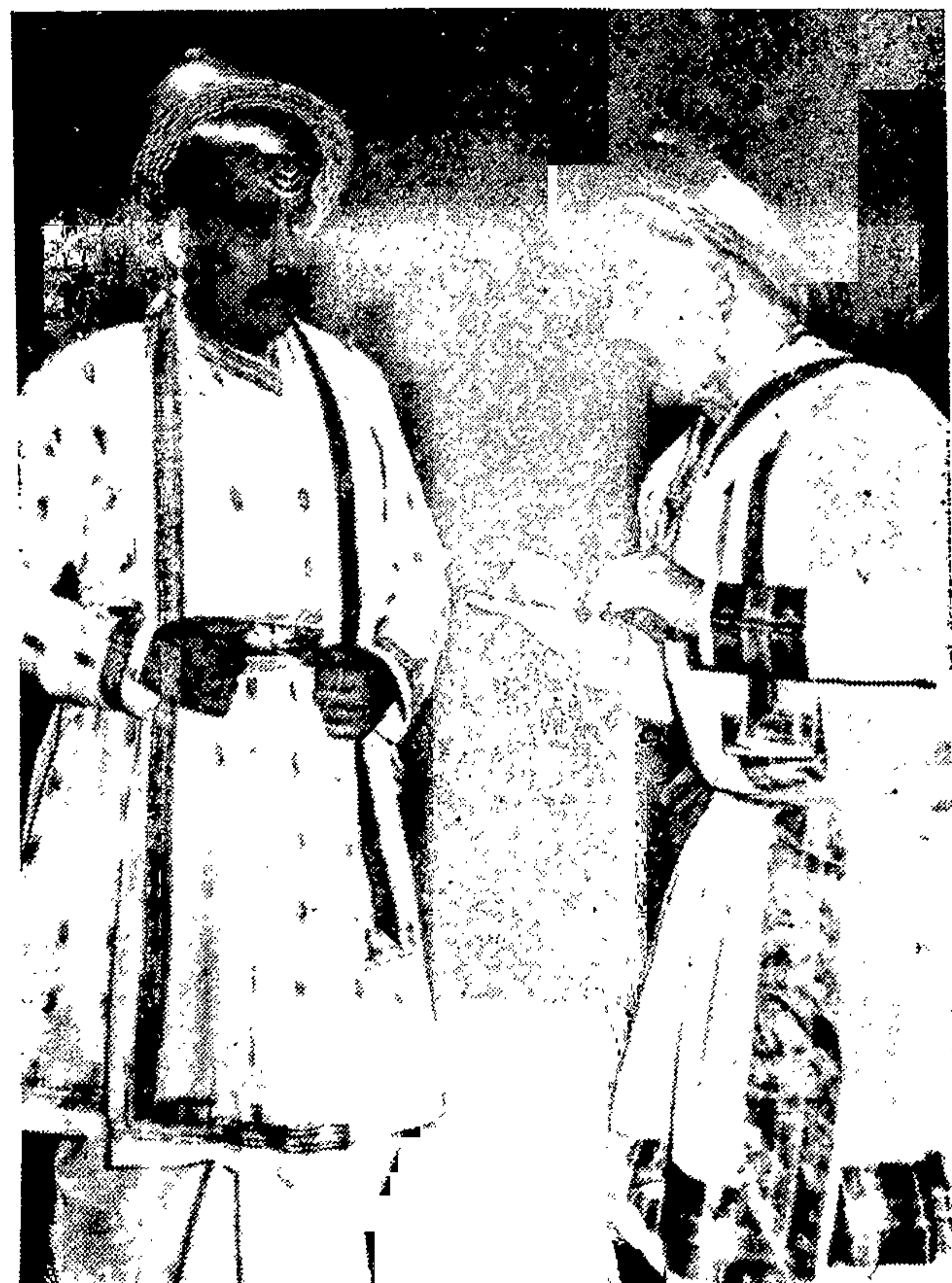
सावित्रीबाई फुले यांच्या वरील चांडाळचौकडीचा हल्ला थोपवि- तांना -जोतीराव (अंक १ प्र. ४)