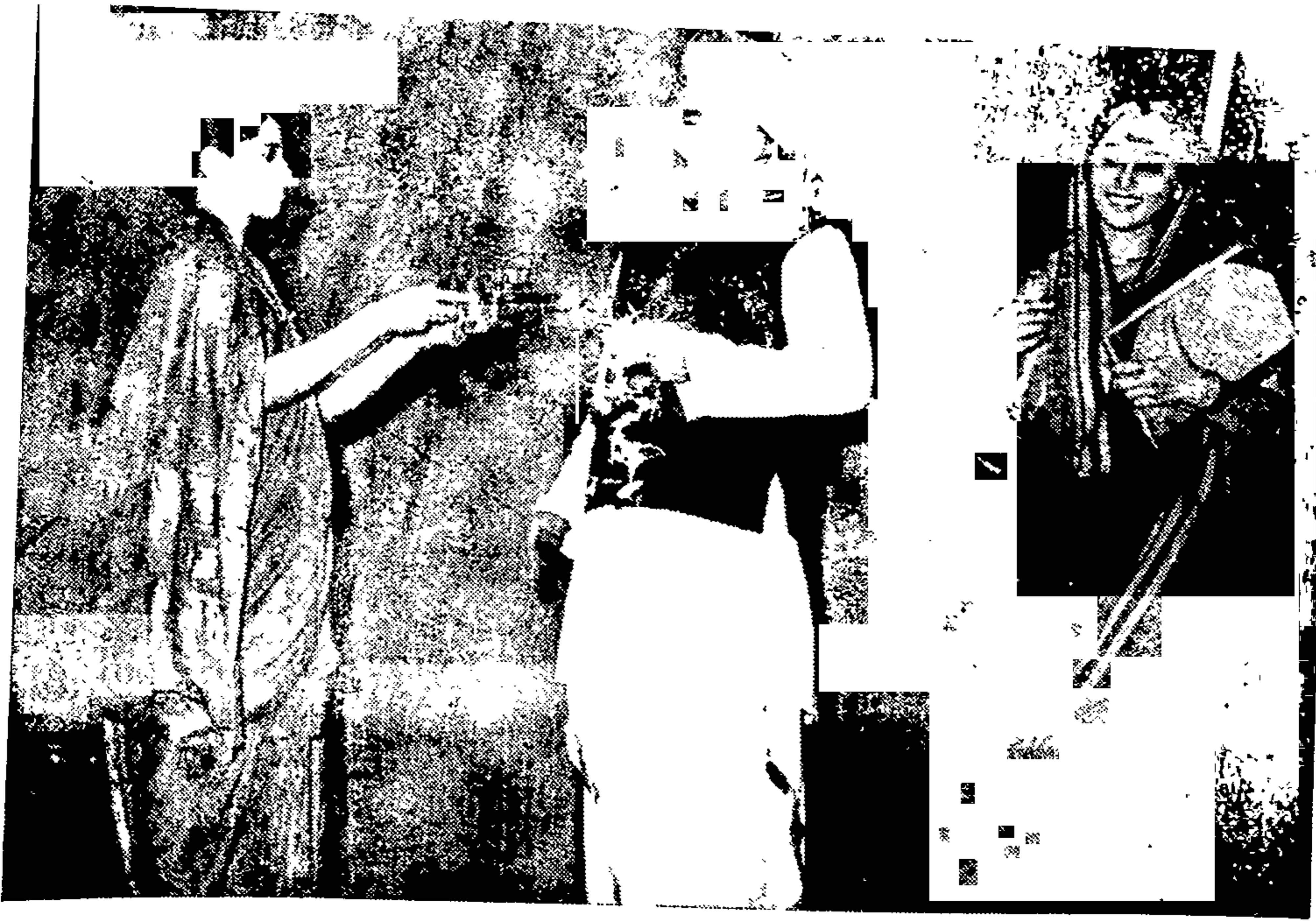
जोतीराव फुले पुणे नगरपालिकेचे सभासद निवडून आले.