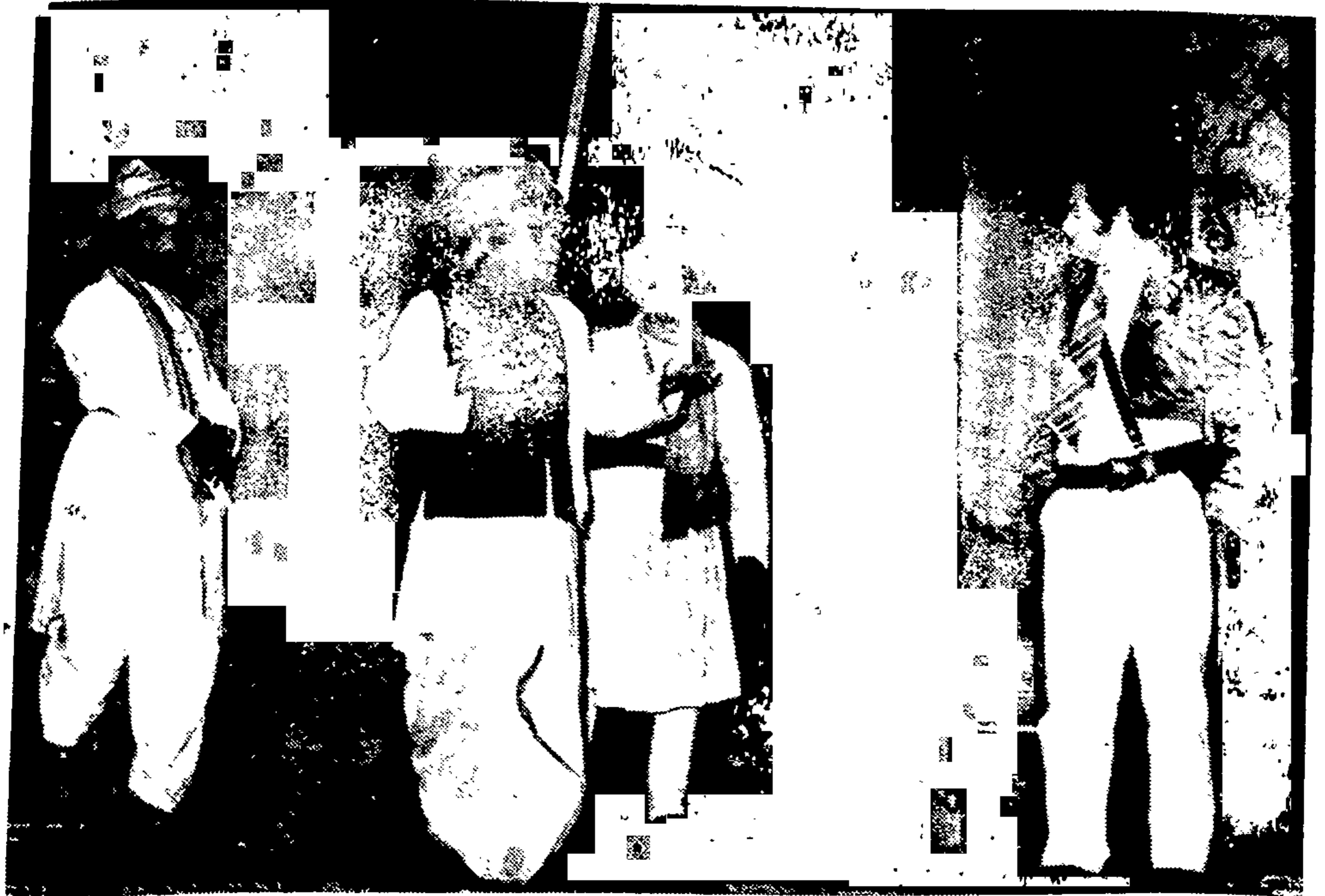
टिळक-आगरकर यांची डोंगरीच्या जेलमधून सुटका झाल्यावर जोतीराव फुले यांनी