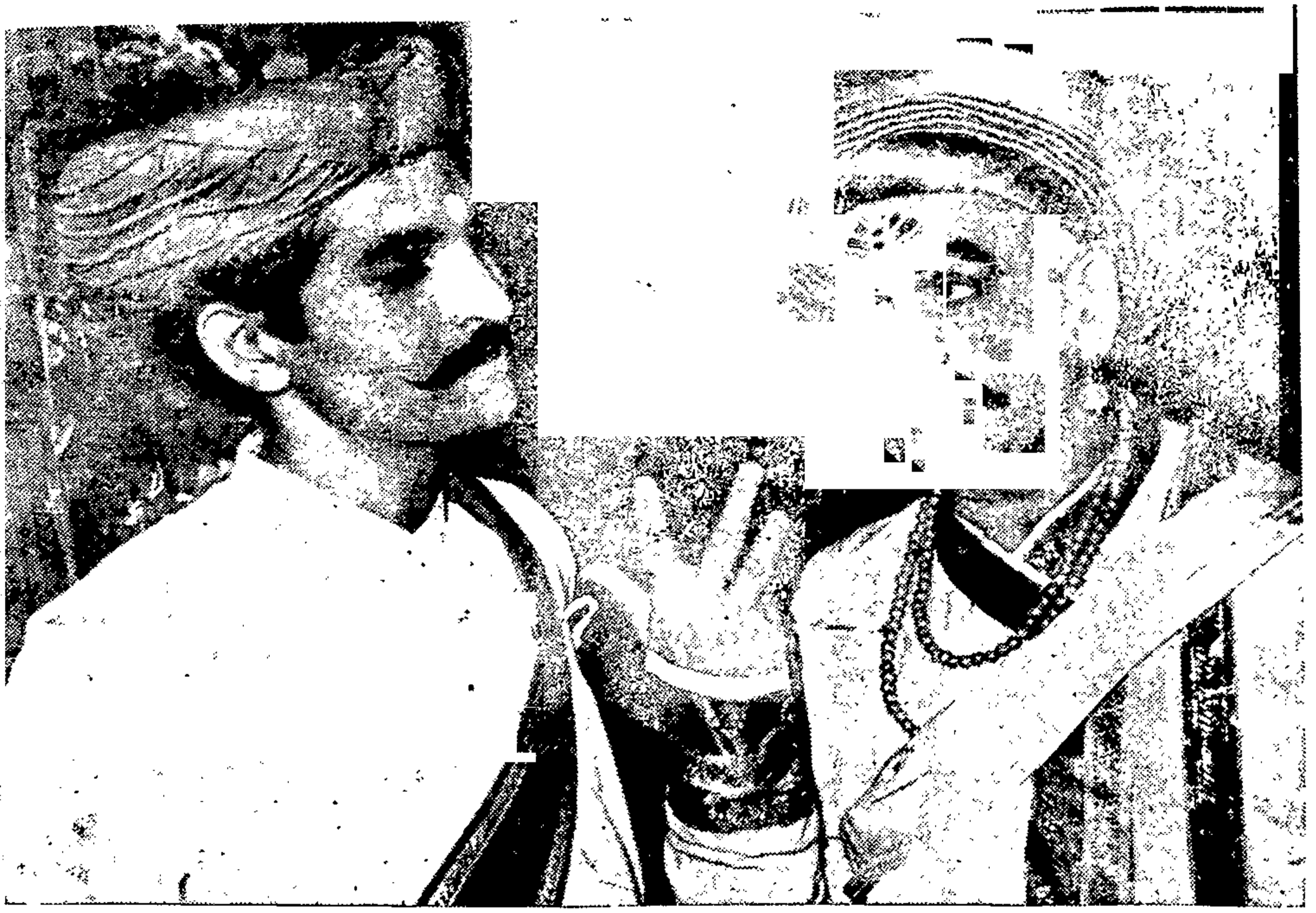
न्यायाधिकांकडे तक्रारींची वर्णी लावण्यासाठी खलनायकाची सेवकांकडे तरफदारी (अंक १ प्र. १)