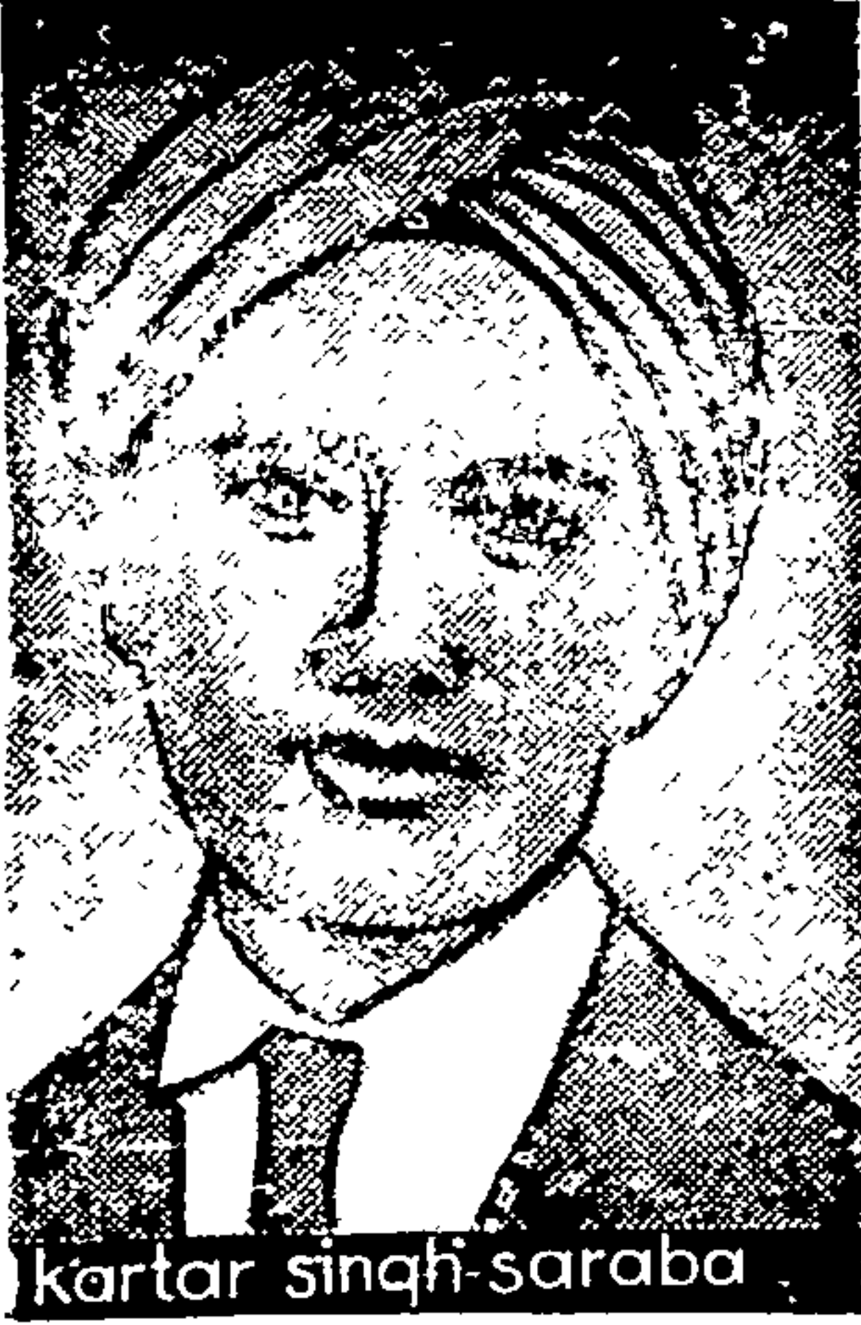
बागी कर्तारसिंह सरावा