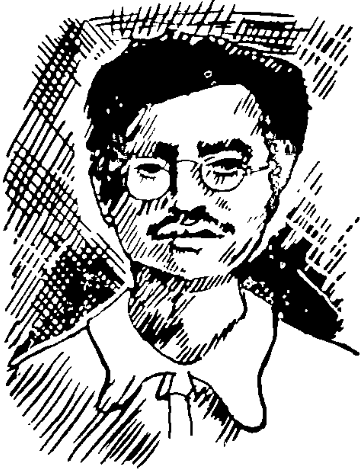
शहीद कन्ह्यालाल दत्त