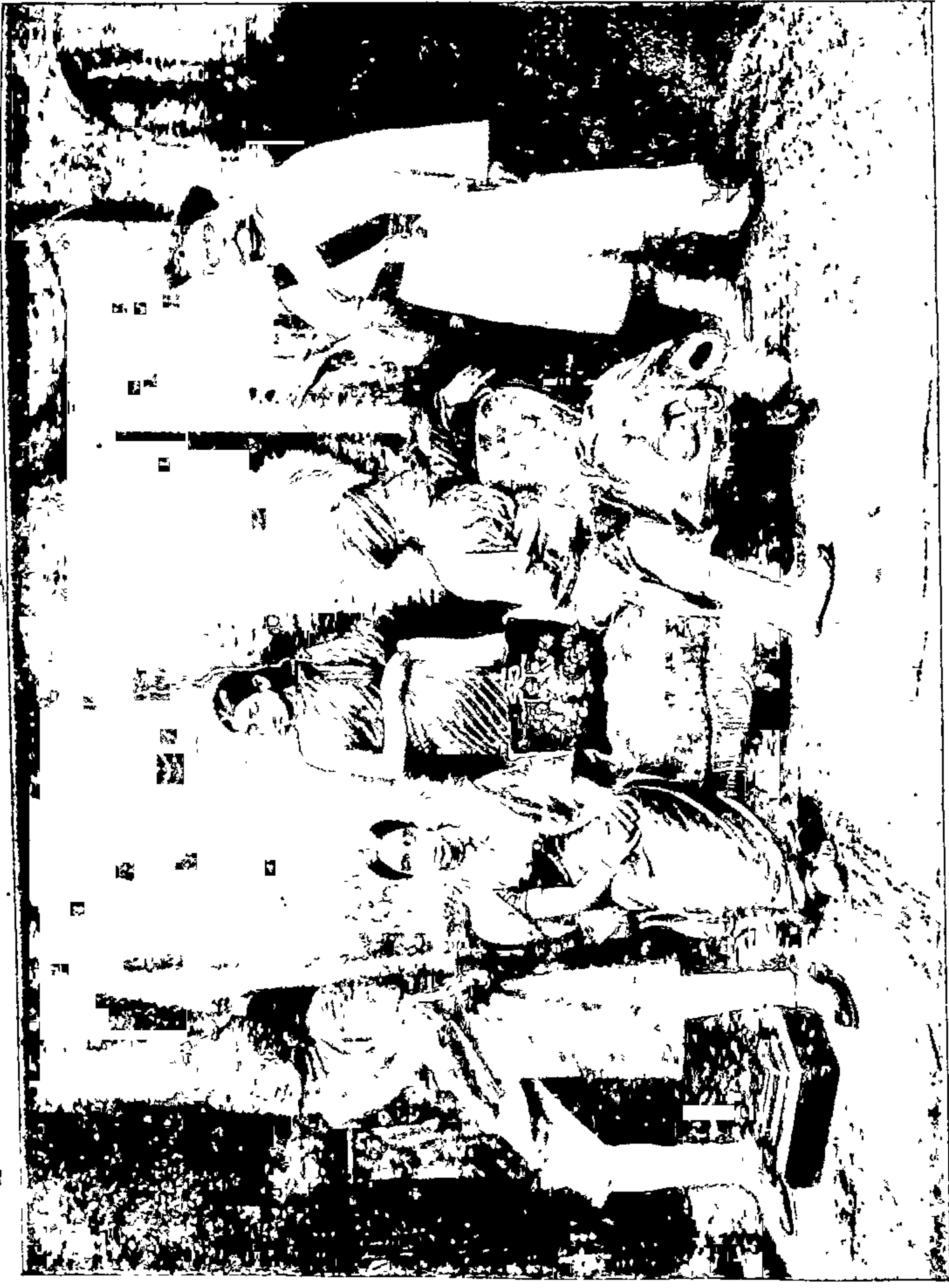
नरवाहनः-असलें तीन्तोंडी दरबार गृहणजं त्रिधारी निवडुंगच म्हणायचें ! ( पृ. १२०।१२१ )