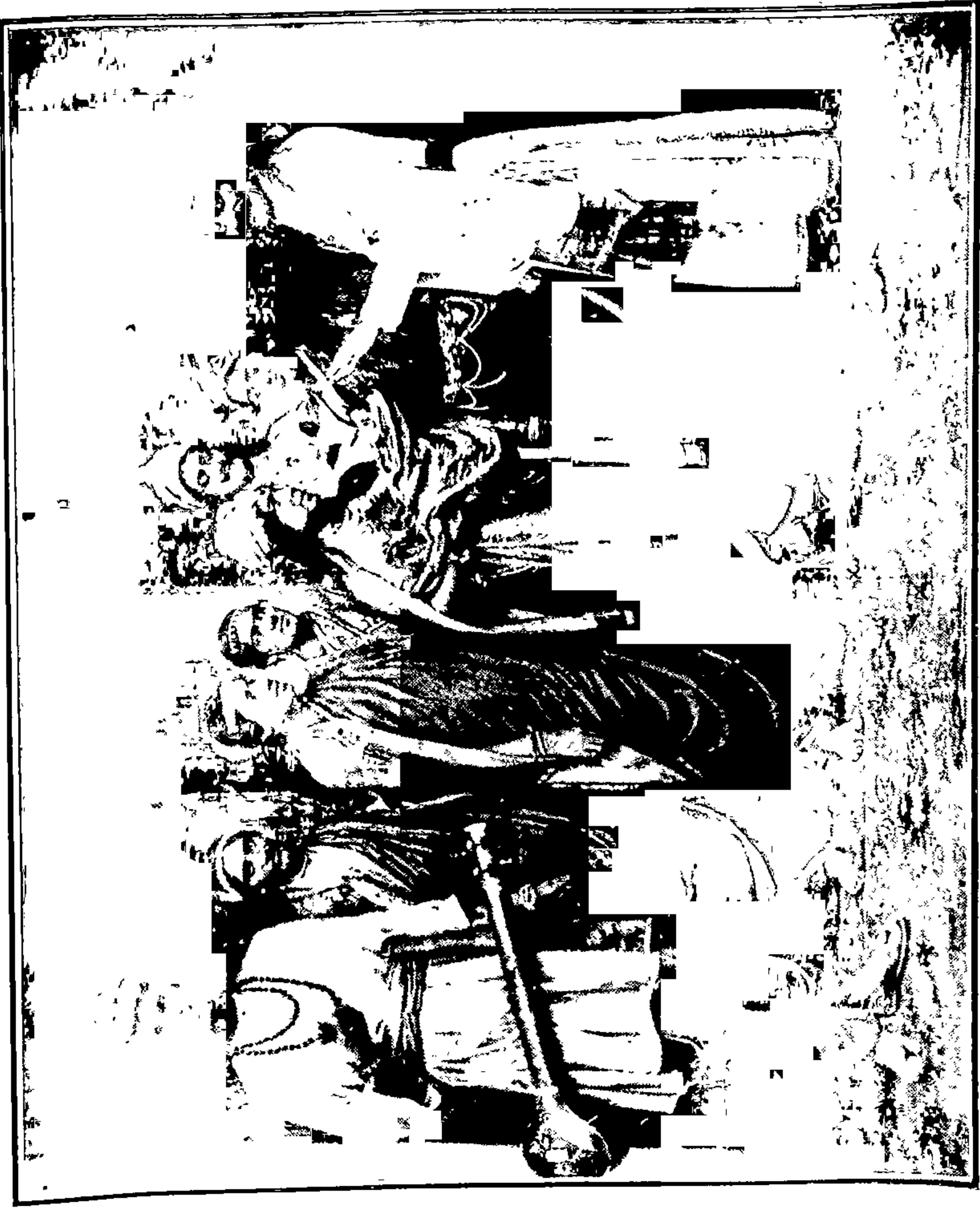
भारतमाता:—माझा हा लाल तुझ्या पायावर घालते, त्याला आशीर्वाद दे.