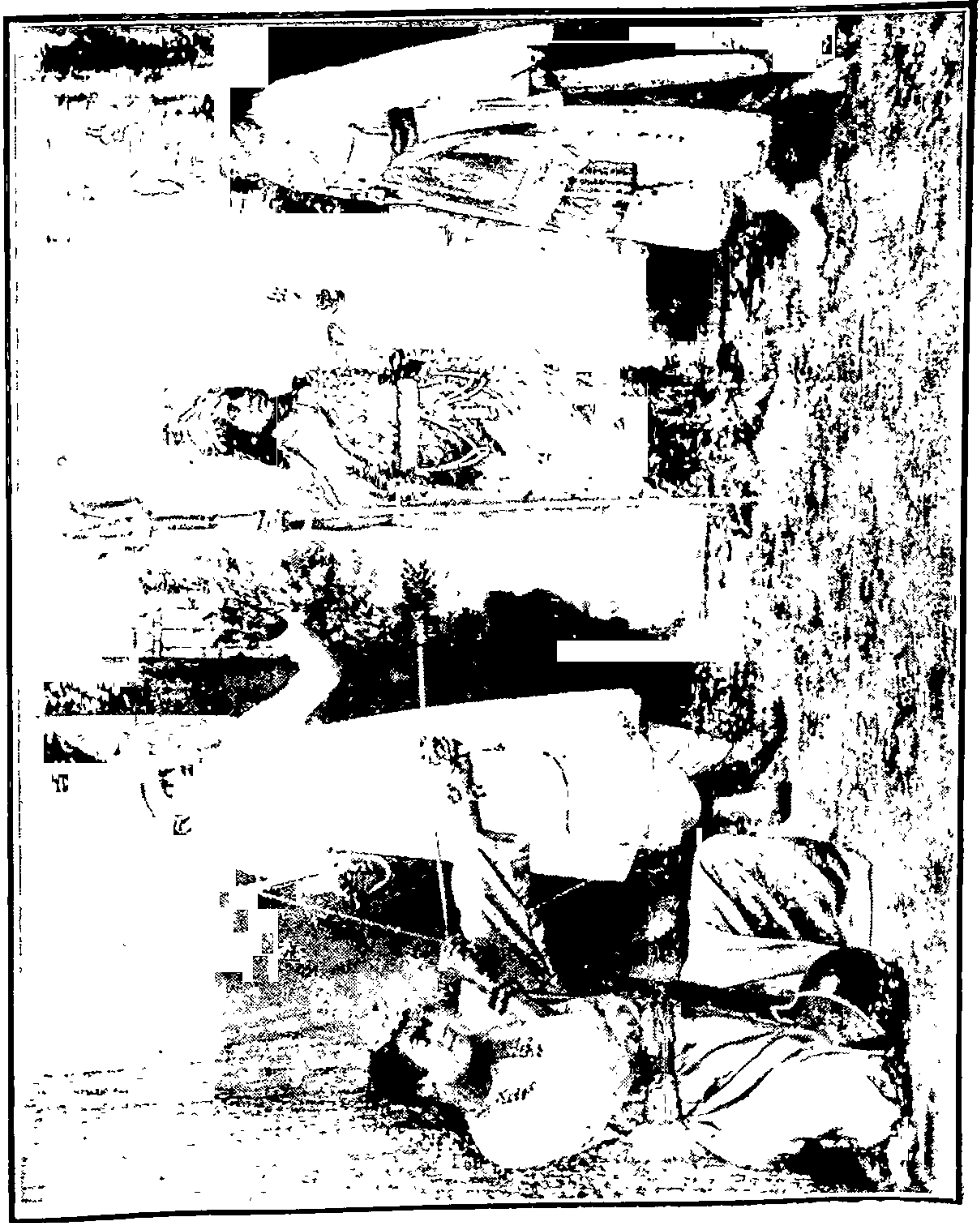
भारतमाता:—हांं हांं नारायणा, चक्र आटोपा.