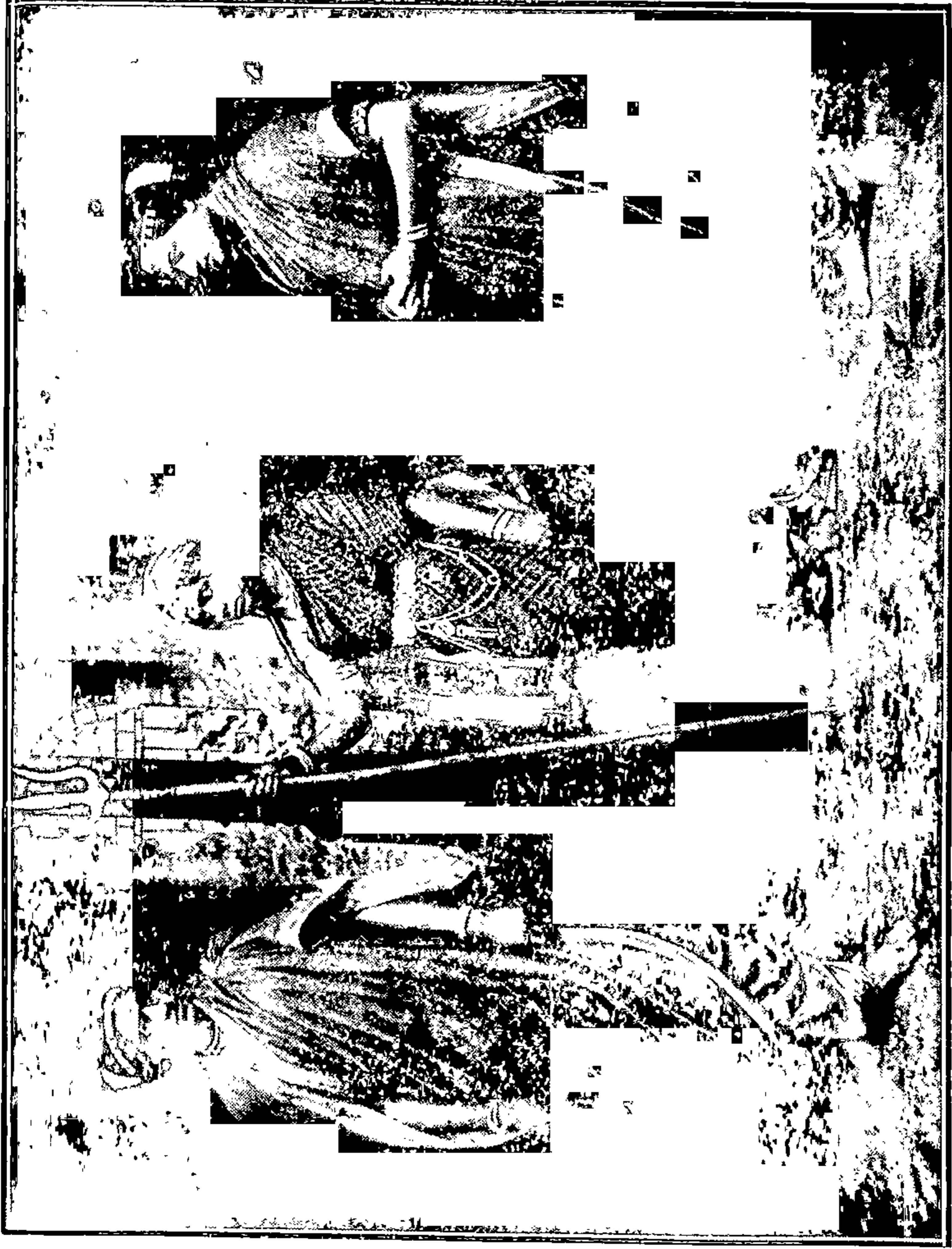
भारतमातः:—जा त्याला सांग, भाग्यश्री भारतमाता आली म्हणून.