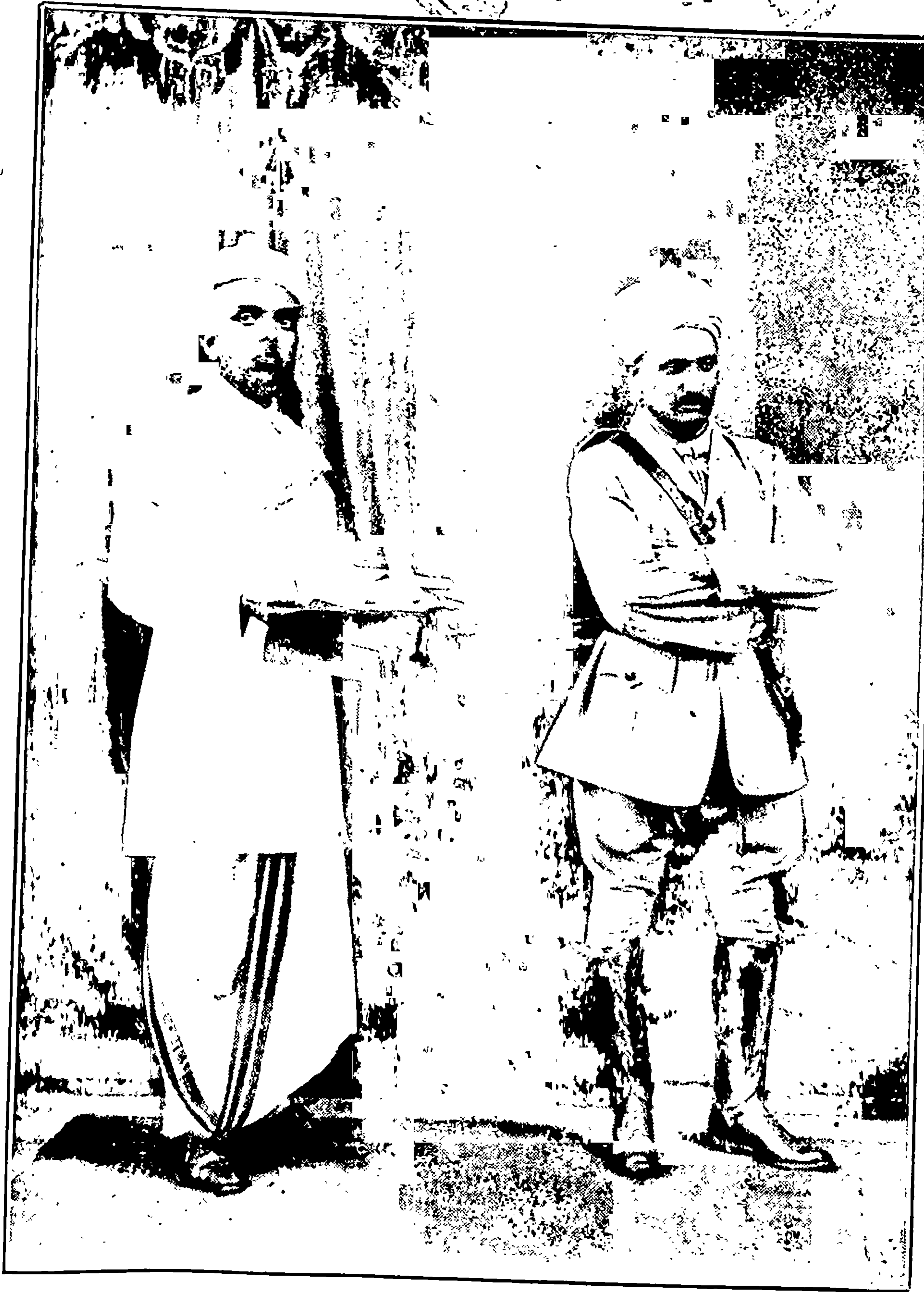
रावसाहेब० - कोण हा दुर्धर प्रसंग !