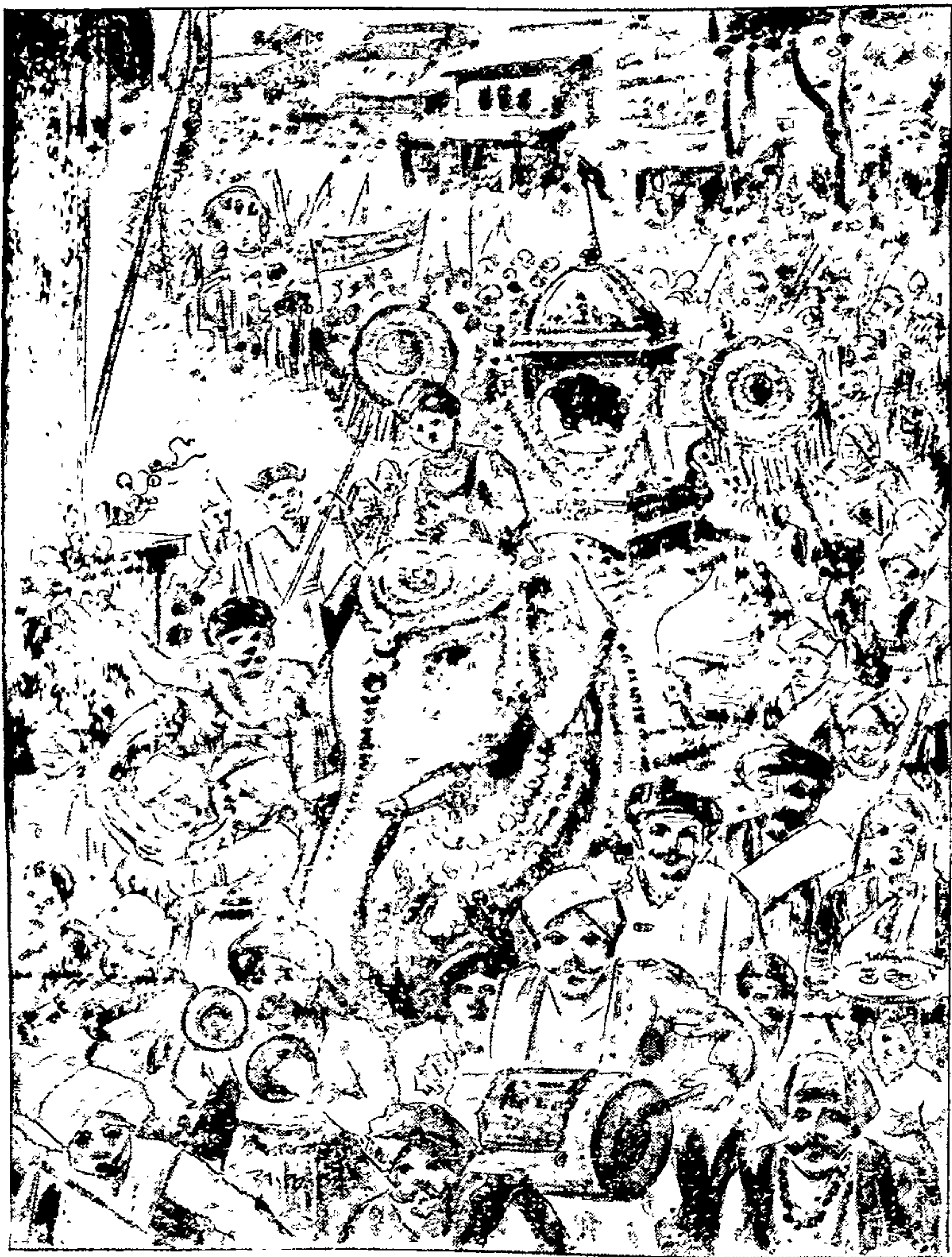
श्री नाथांच्या ग्रंथराजाची मिरवणूक