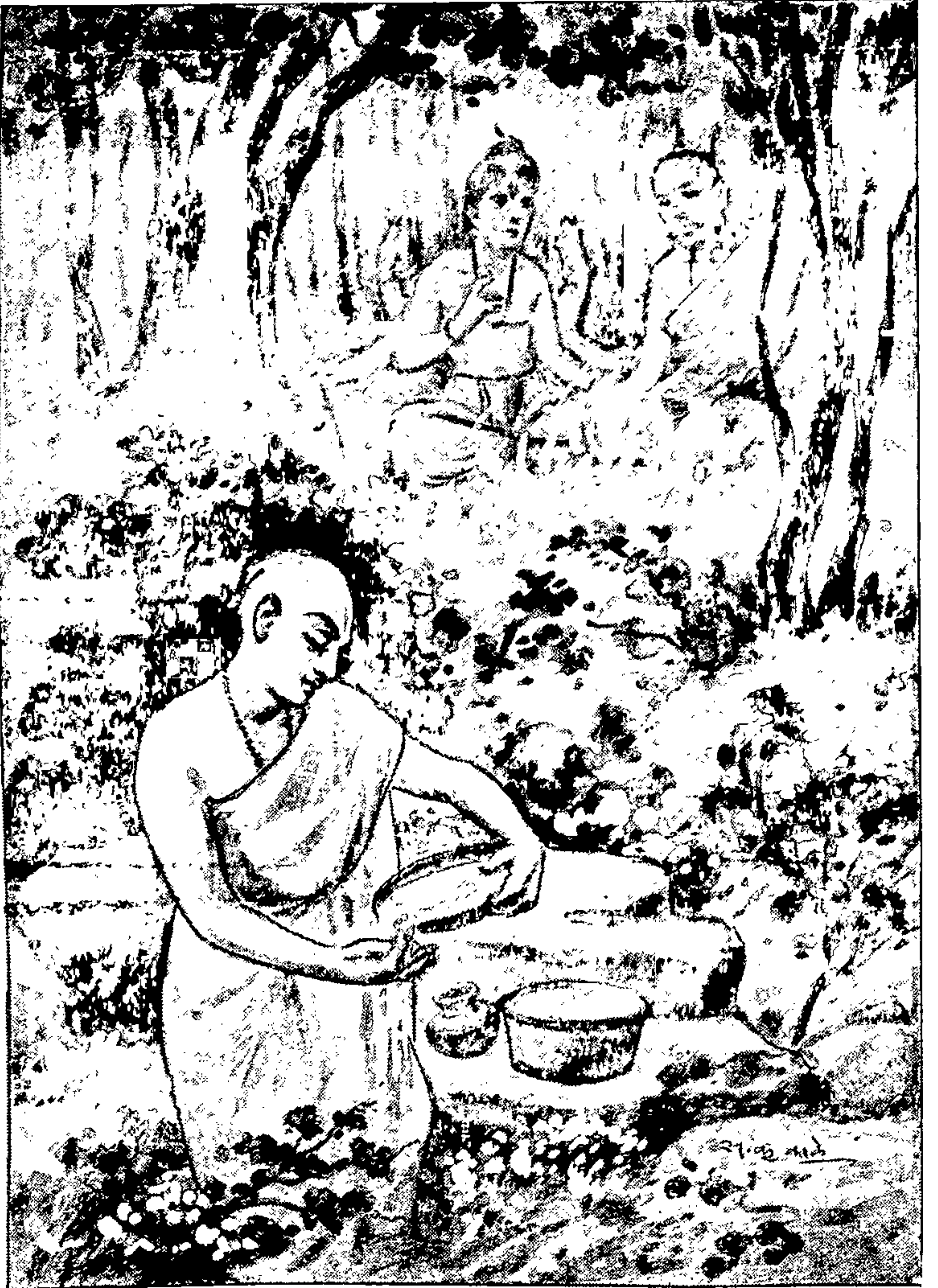
श्रीदत्त-दर्शन व प्रसाद ग्रहण