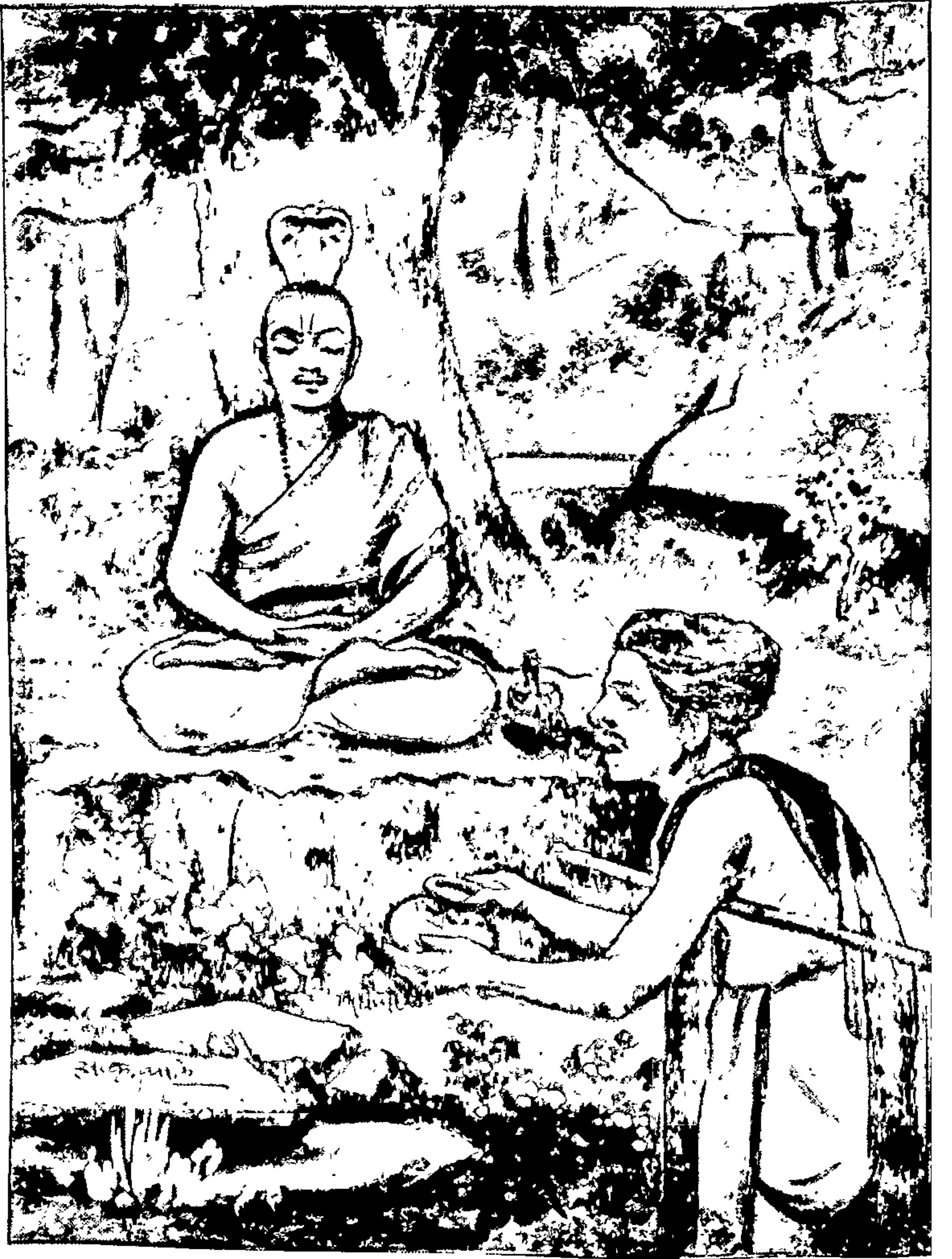
गुरुआज्ञेनै नाथांचे योगसाधन