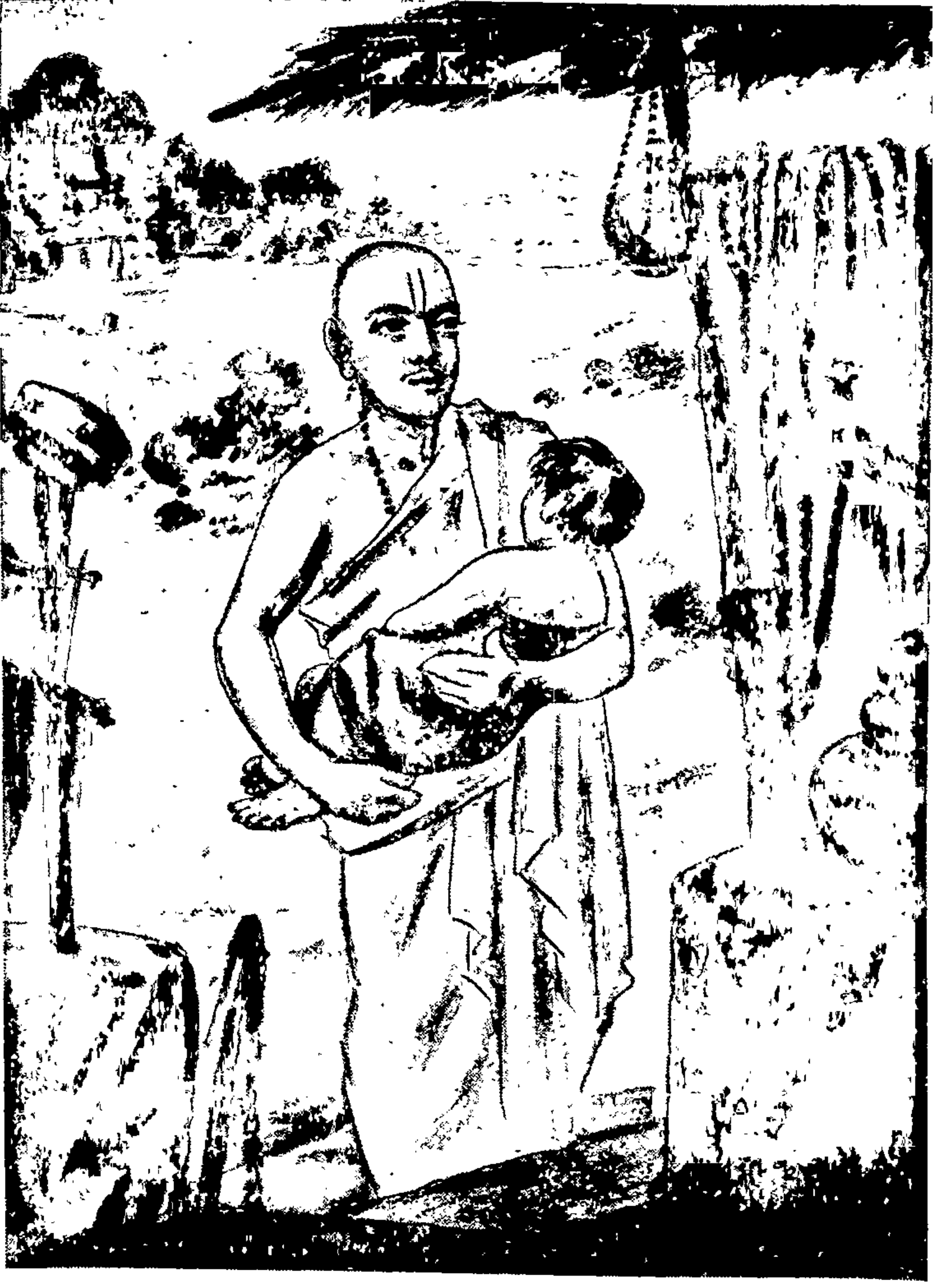
कनवाळू नाथांचा दयाळूपणा