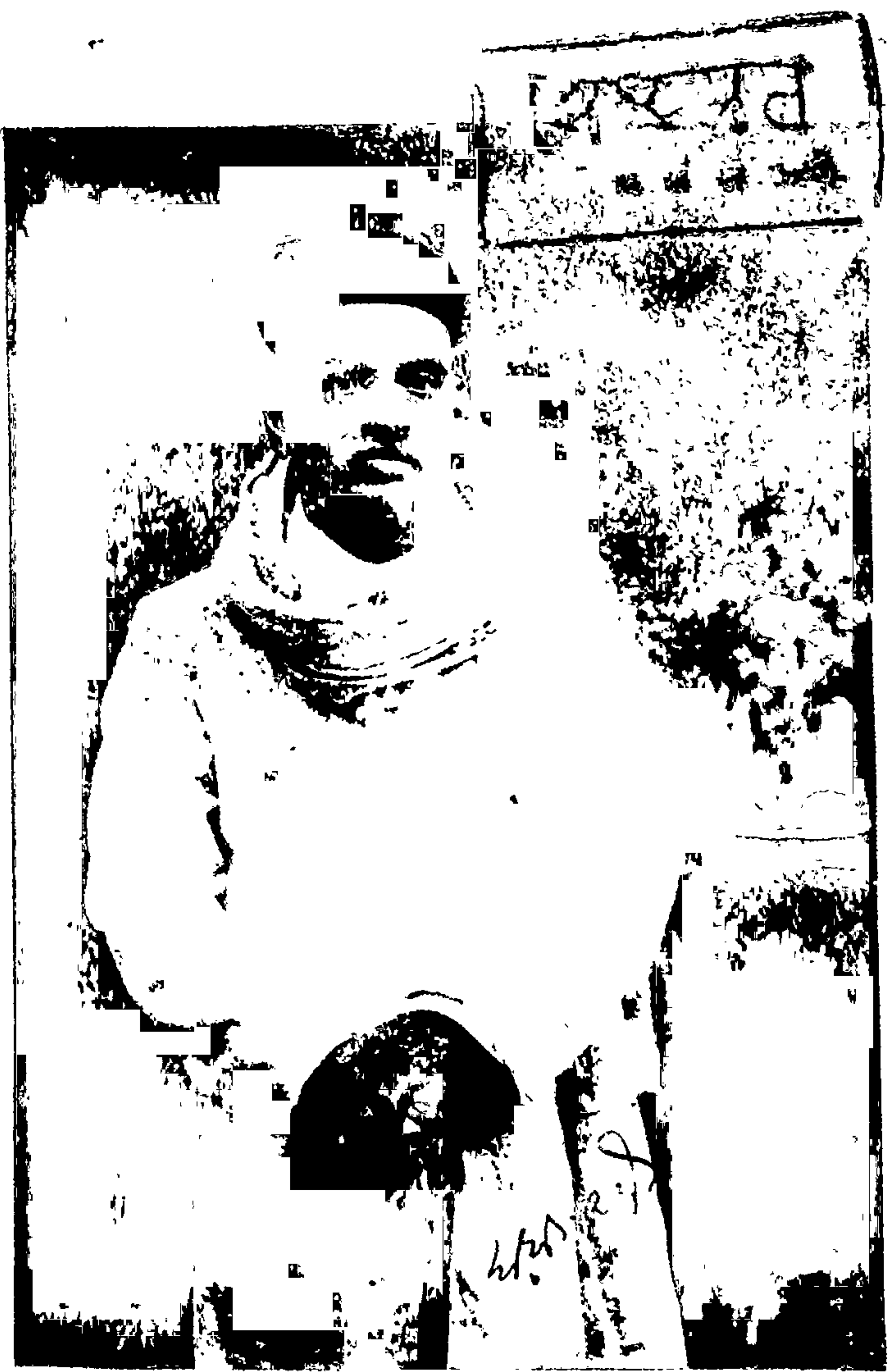
लोकनायक माधव श्रीहरी ऊर्फ बापूजी अणे १९३१.