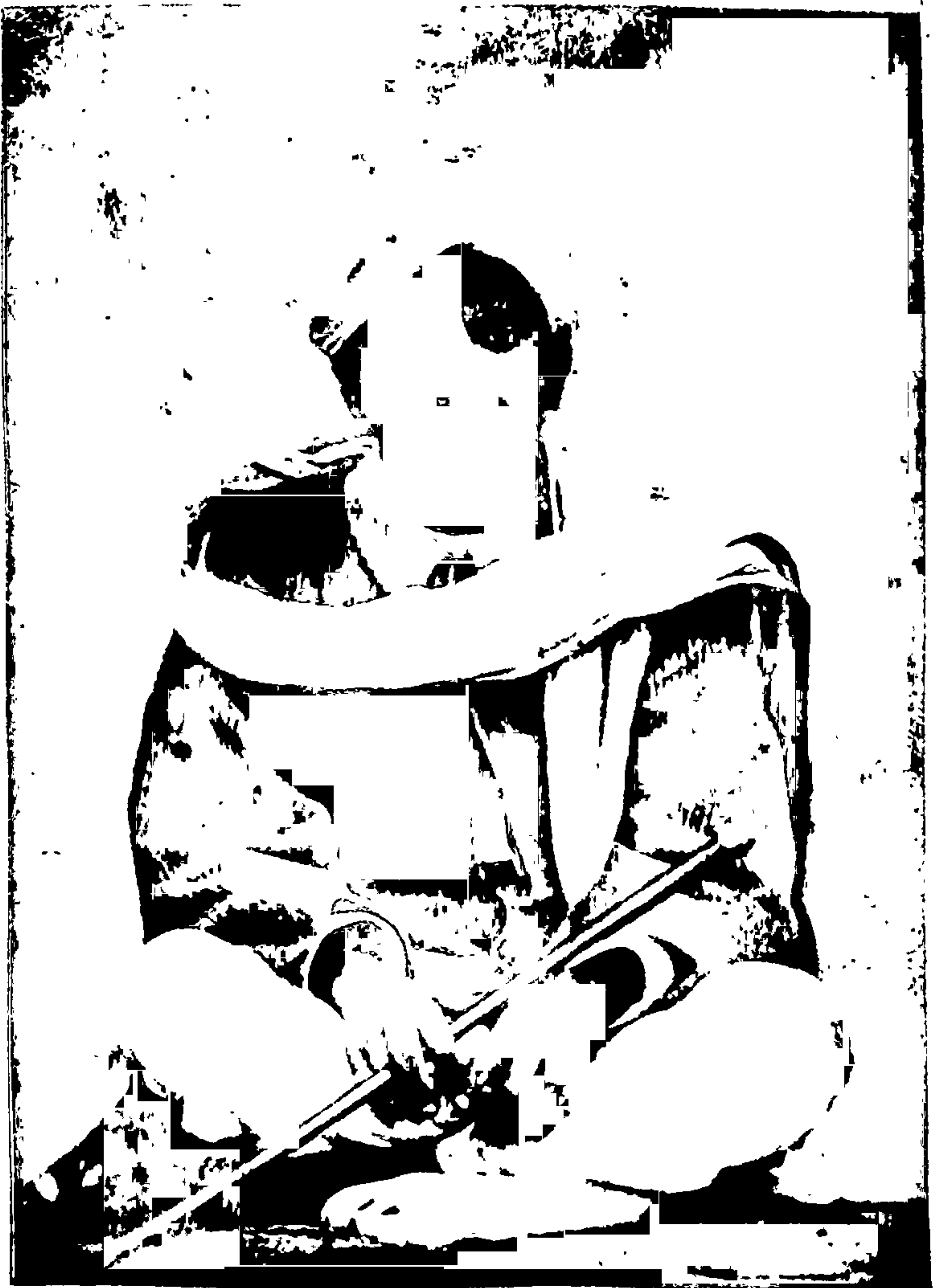
लोकनायक माधव श्रीहरी ऊर्फ बापूजी अणे (१९०९)