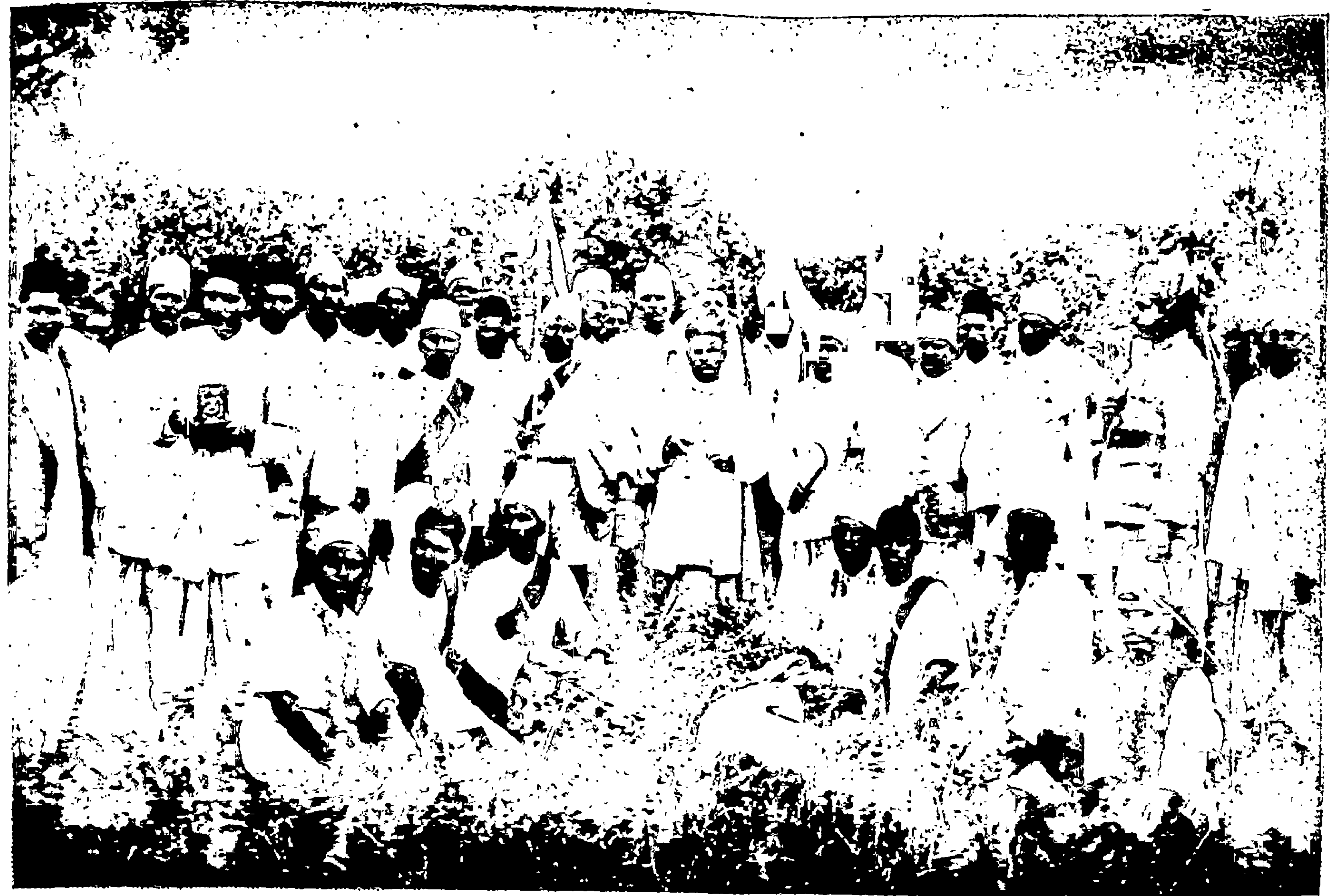
लो. ना. बापूजी अणे यांचा जंगलचा कायदेभंग — पुसद, १० जुलै १९३०