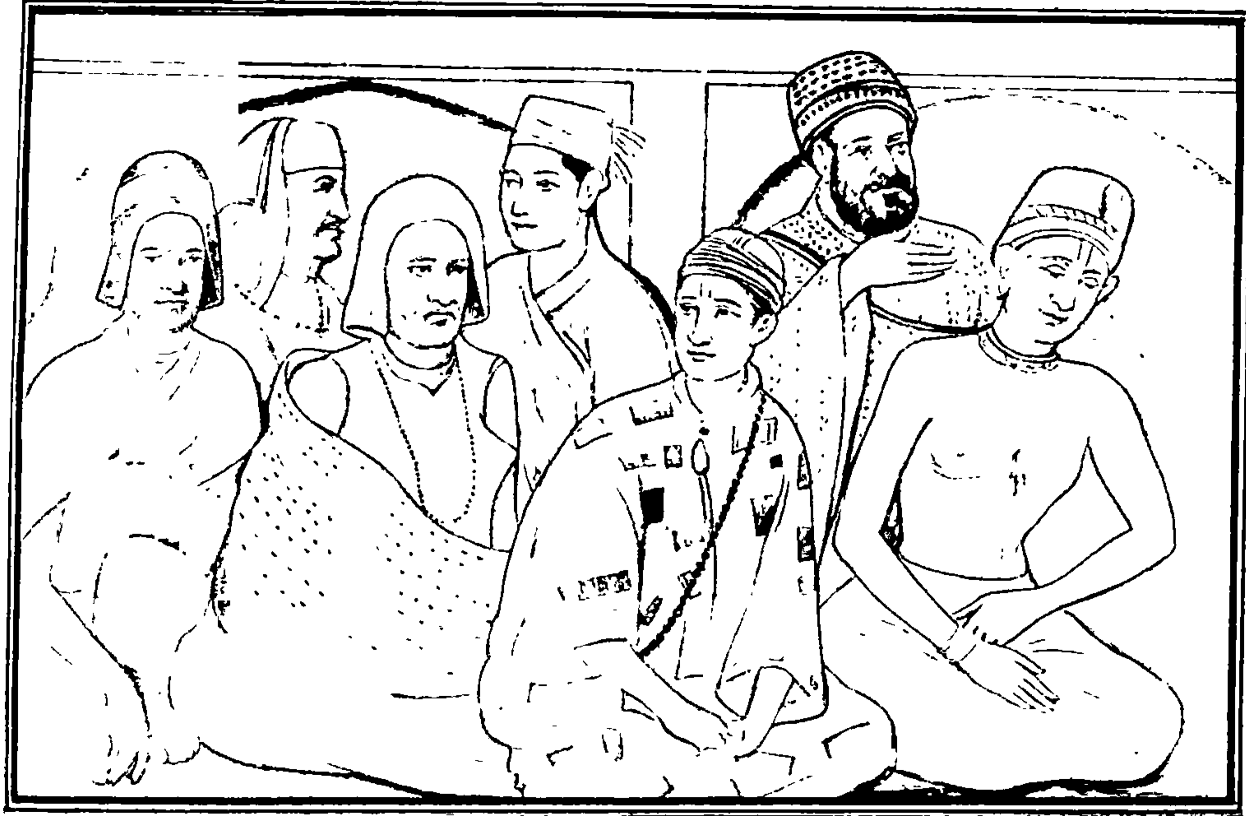
श्री रोहिदास, श्रीपीपा, श्रीनामदेव, श्रीसेना न्हावी, श्रीकमाल, श्रीअगहर, श्रीकबीर.