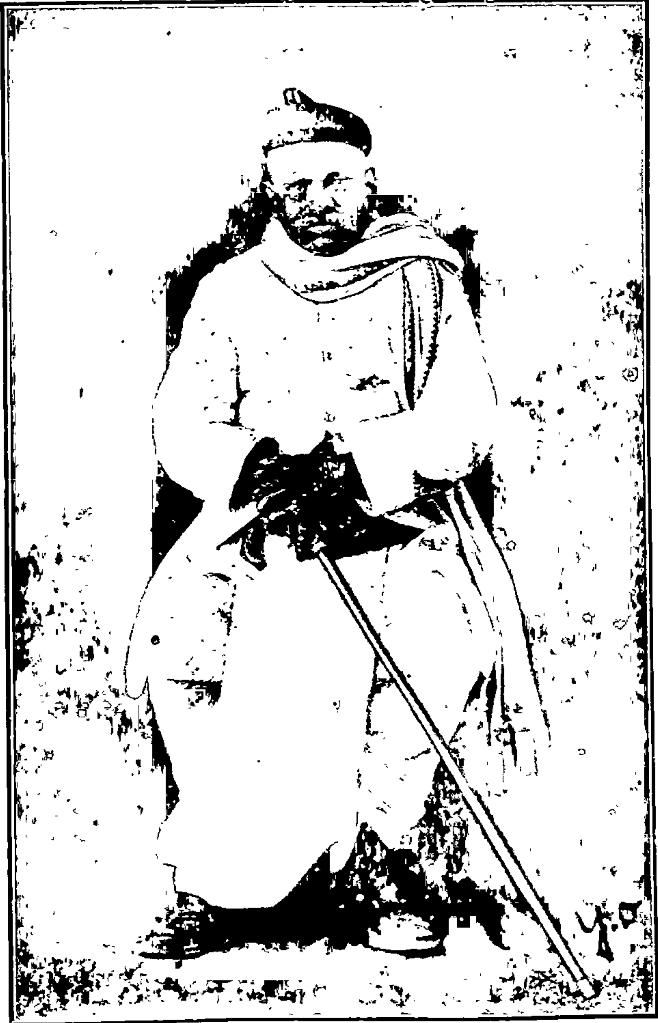
लोकनायक बापूजी अणे.