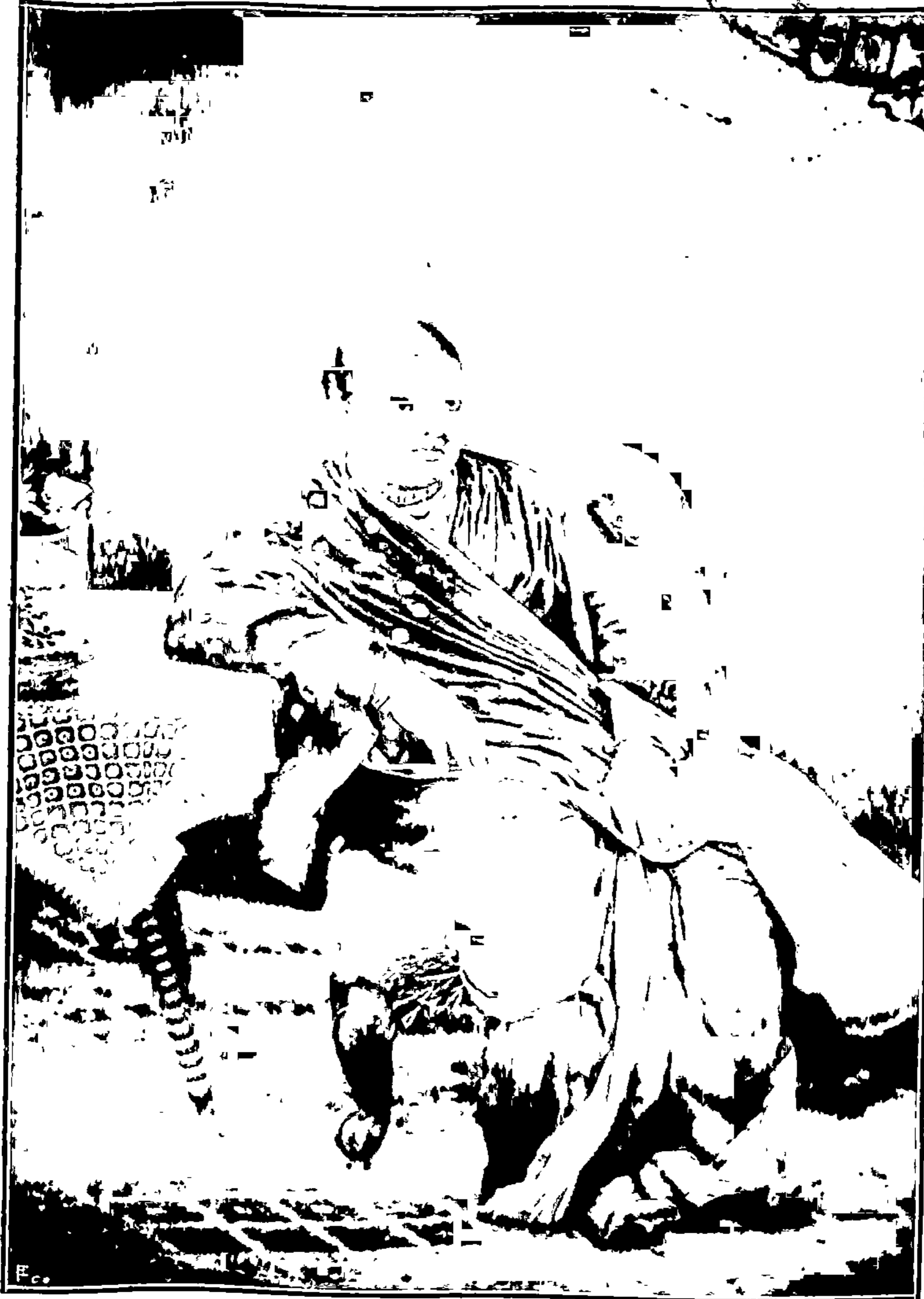
श्रीमती रमाबाई रानडे.