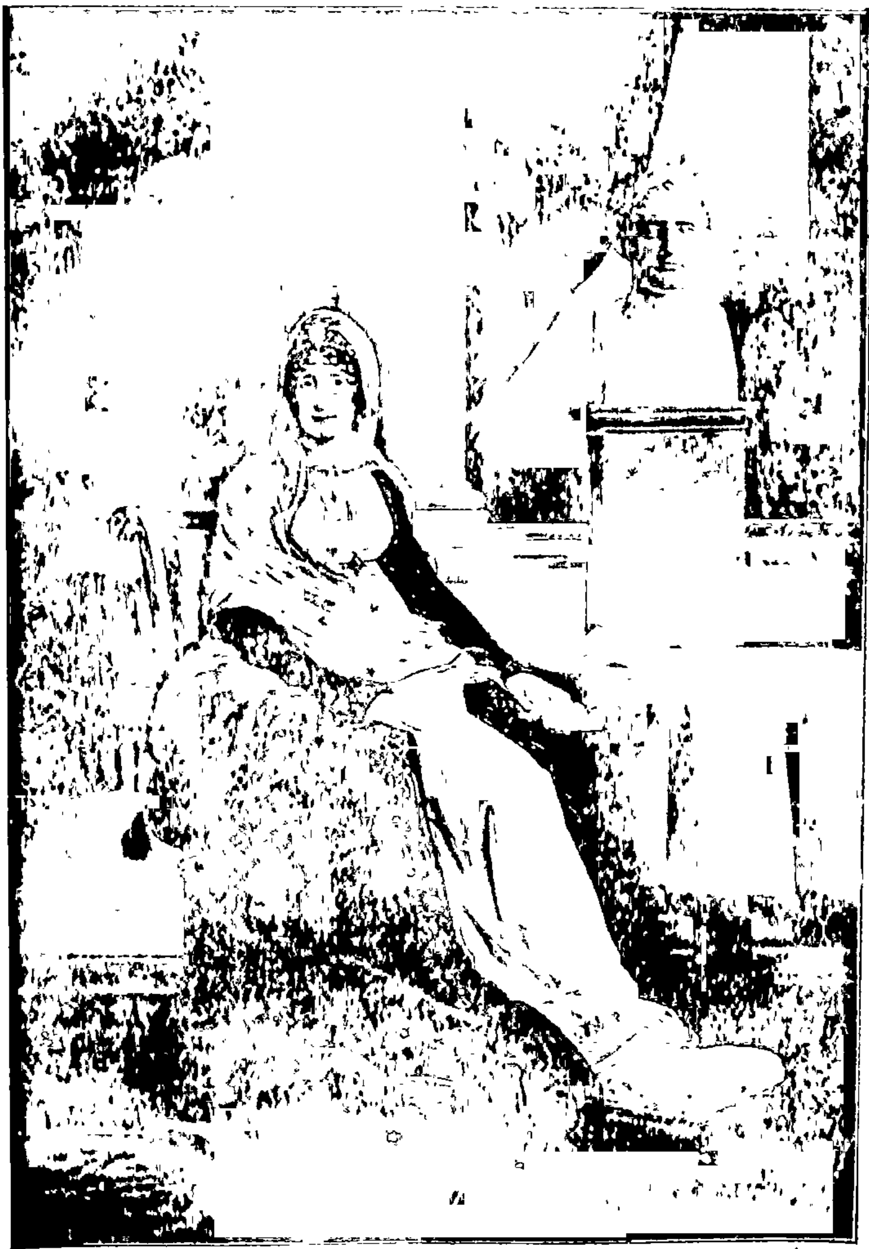
नेपोलियनची ( महत्वाकांक्षी ) माता.