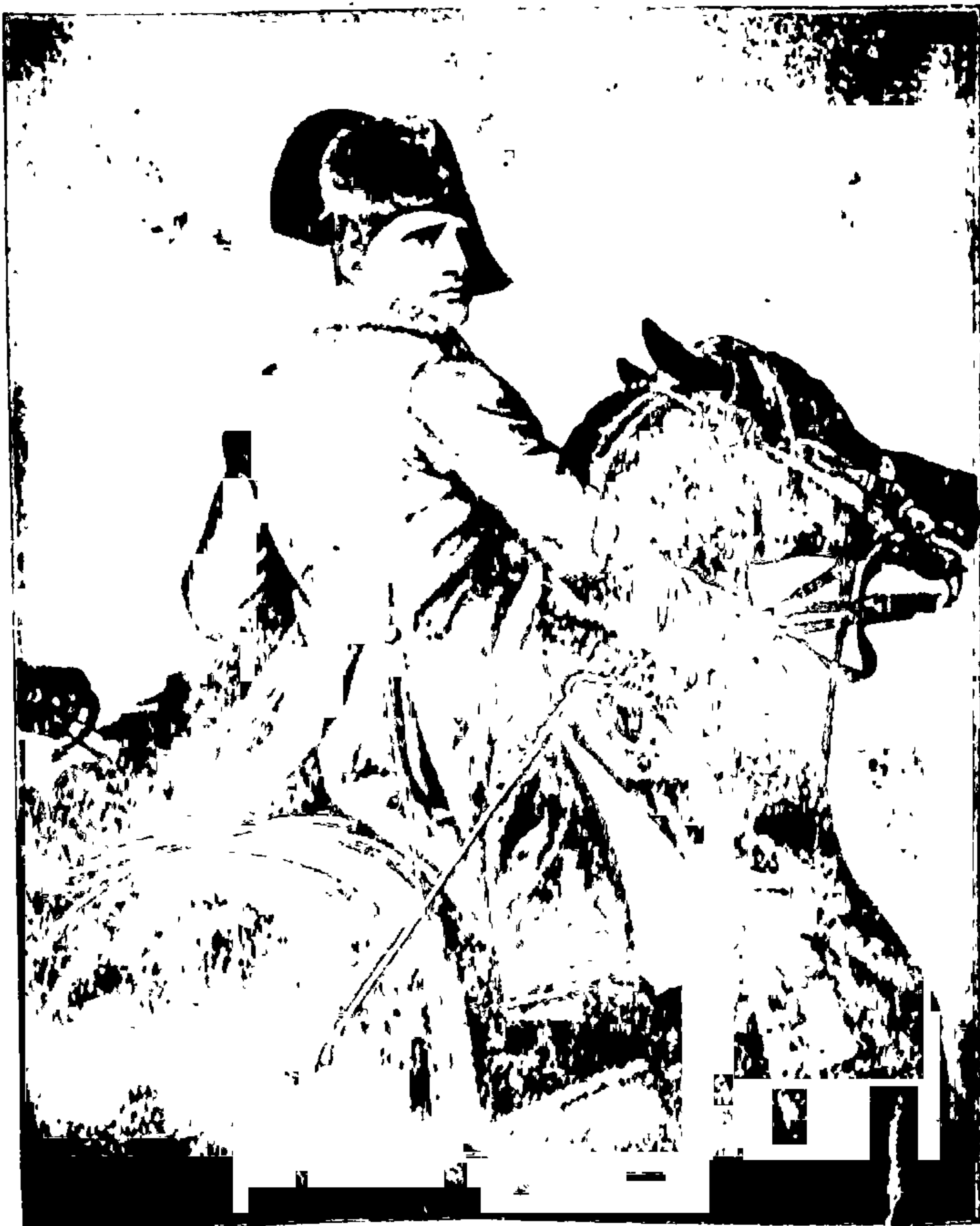
नेपोलियन लष्करी पोषाकांत. (जेन्ना)