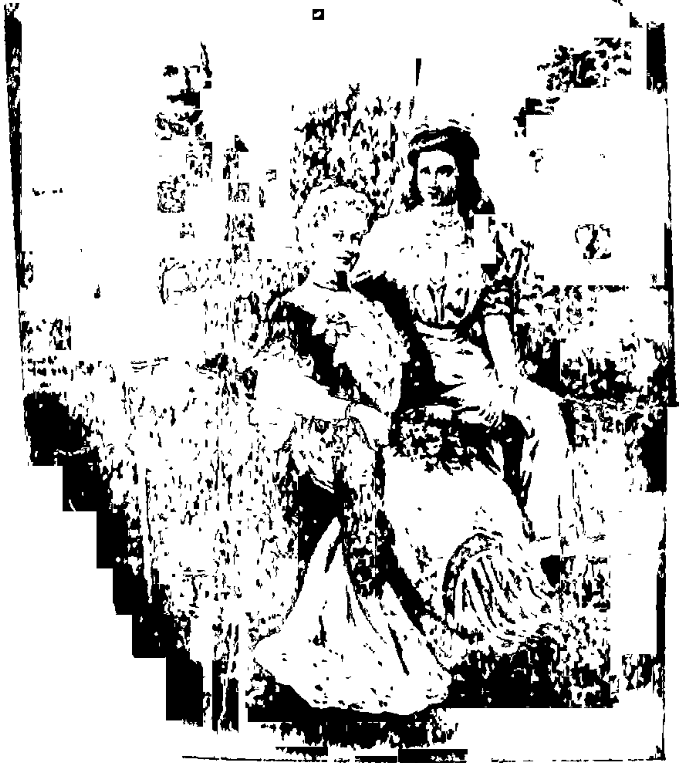
दुसरा, जर्मन राणी व राजकन्या.