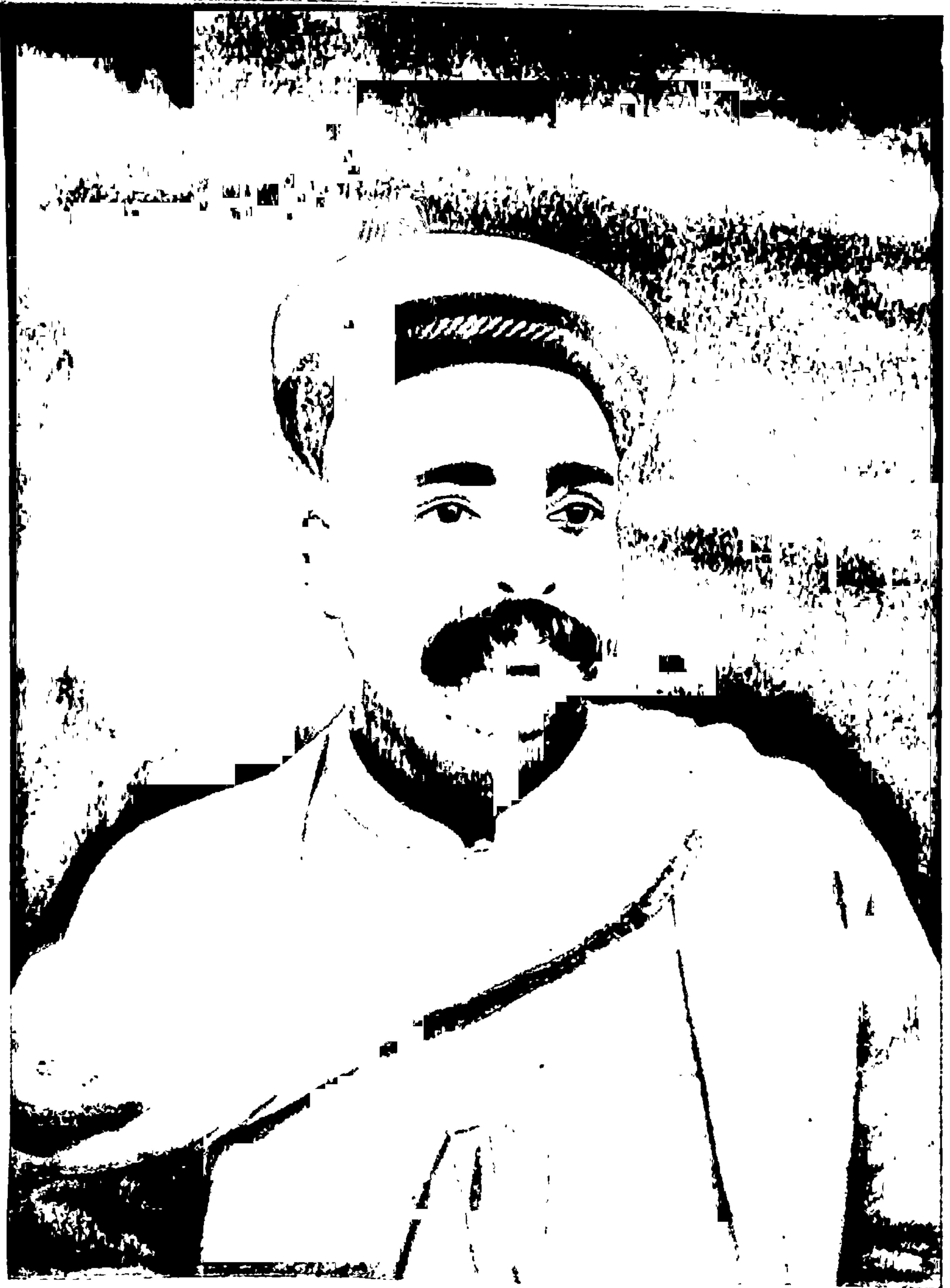
कै. लोकमान्य बाळ गंगाधर टिळक